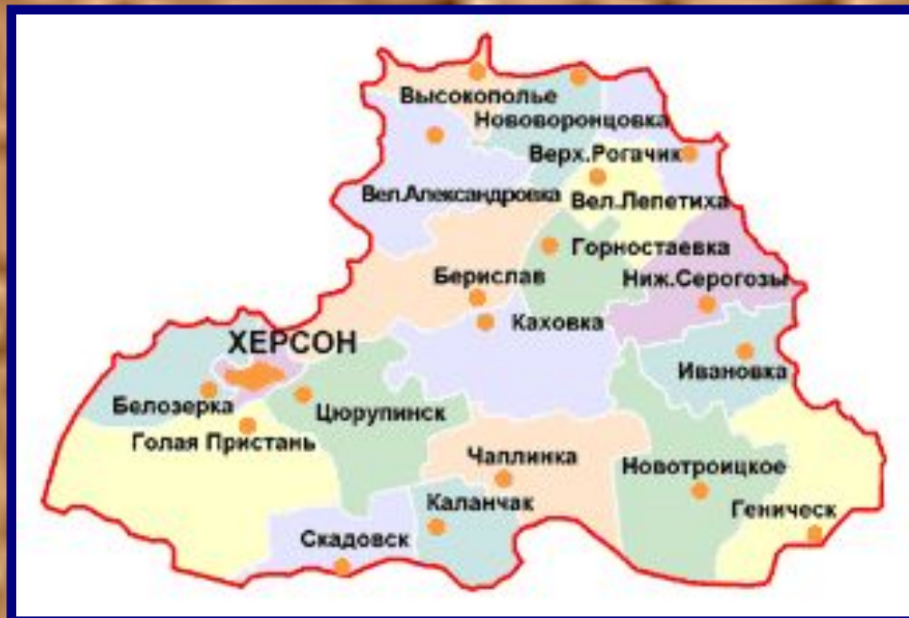
Николаевская область (с 1944г.- Херсонская)