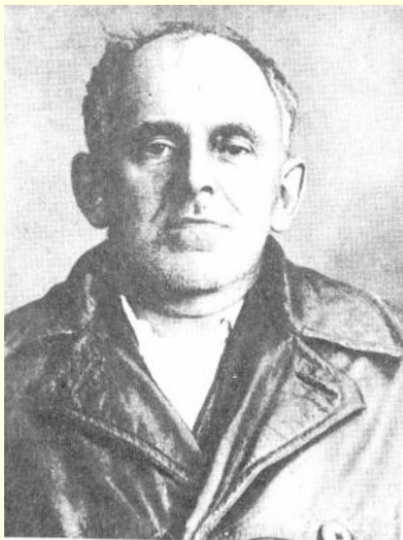
Последняя фотография О. Мандельштама Из личного дела в Бутырской тюрьме