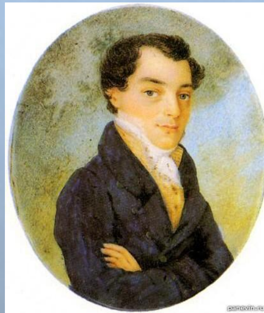
Кондратий Фёдорович Рылеев