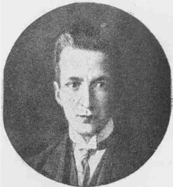
Лидер трудовиков, член партии социалистов-революционеров, Керенский