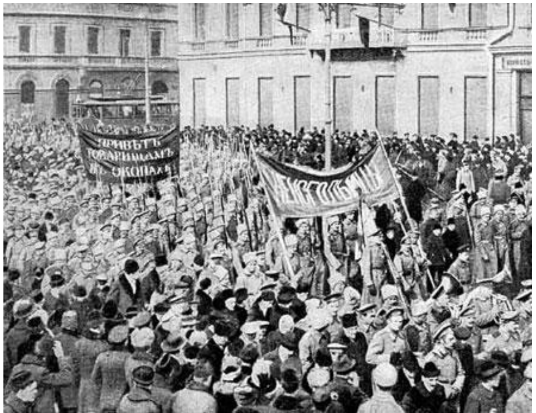
Солдатская демонстрация в Петрограде февраль 1917 года