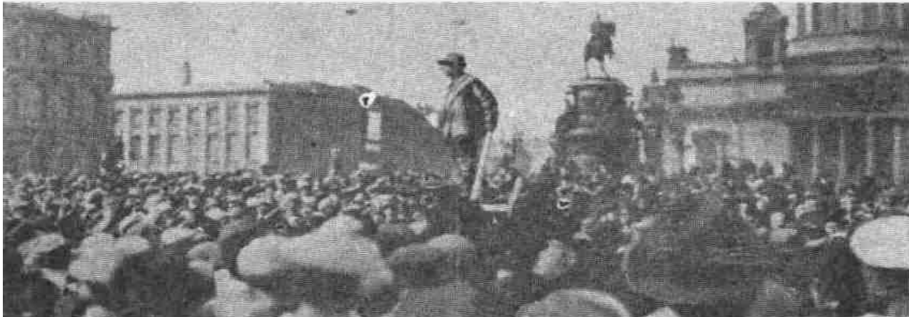
У Государственного Совета.