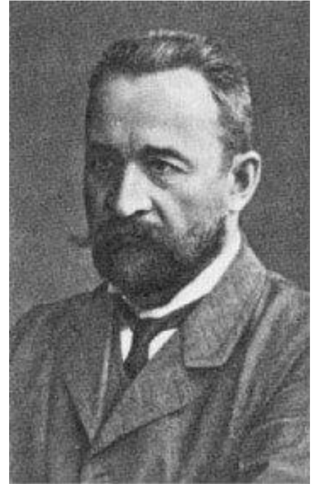
Львов Георгий Евгеньевич - князь, русский политик