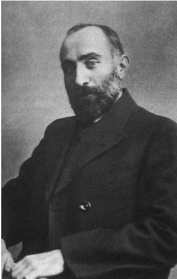
Чхеидзе Николай Семенович