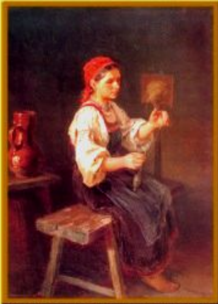
Раньше пряли льняную нить на прялке.