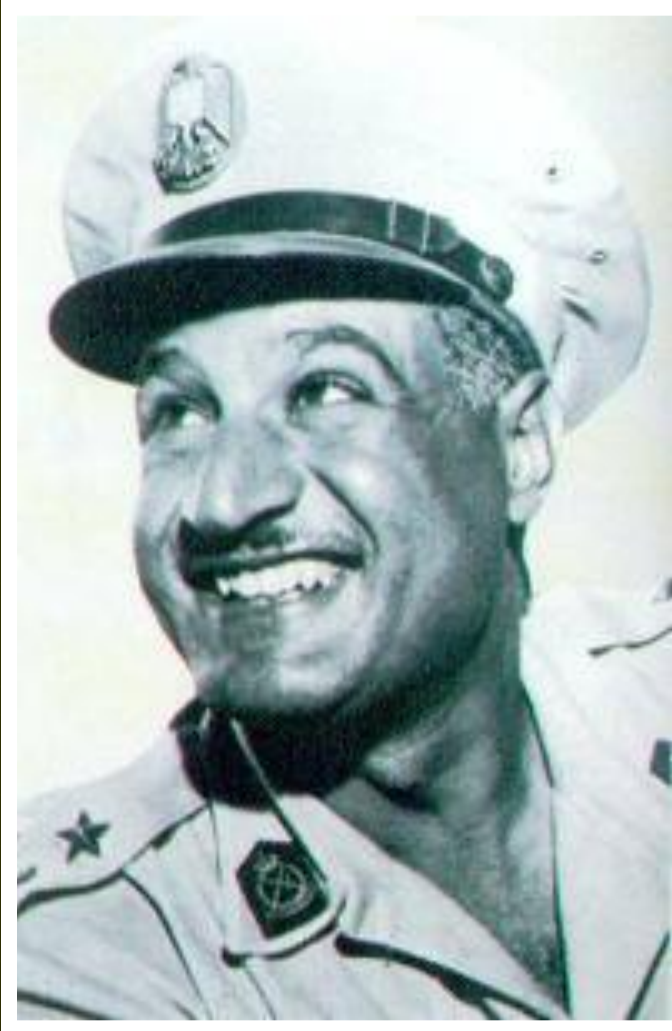
Гамаль Абдель Насер.

Арабы пытались преодолеть свою отсталость за счет использования природных ресурсов. В 1951 г. Иран национализировал нефтяную промышленность. В ответ Запад начал экономическую блокаду. Это привело к государственному перевороту и власть перешла к шаху Реза Пехлеви.