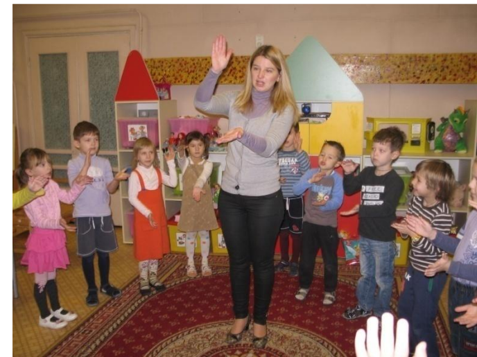
Тест на аплодирование