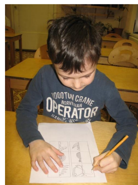
Рисование простых форм