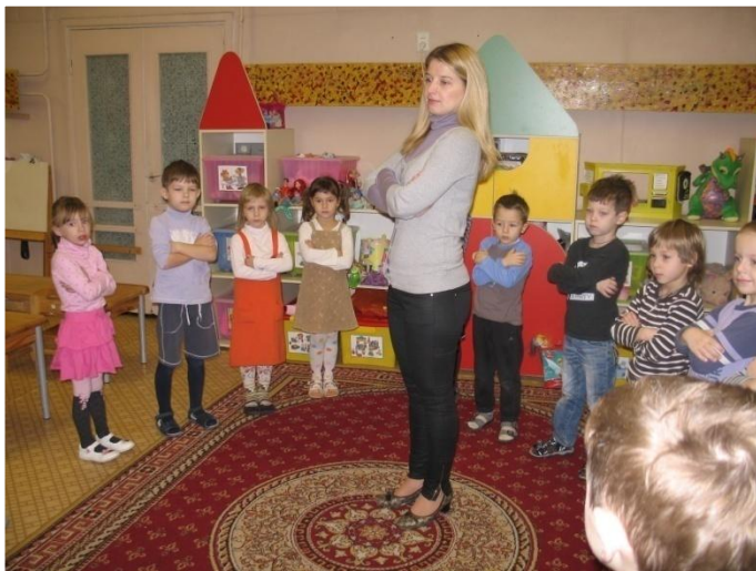
«Поза Наполеона» - скрещивание рук