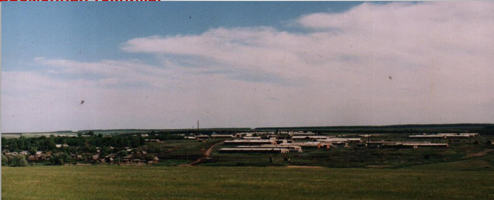
Панорама посёлка. 1970-е гг.

В ноябре 1975 года труженики совхоза получили хороший подарок: торжественный вечер, посвящённый 58-ой годовщине Октября проходил в новом здании Дома Культуры. В 70-е годы XX века совхоз был довольно развитым и сильным хозяйством: развивалось свиноводство, молочно-мясное животноводство, была своя небольшая птицефабрика, на полях работала современная техника.