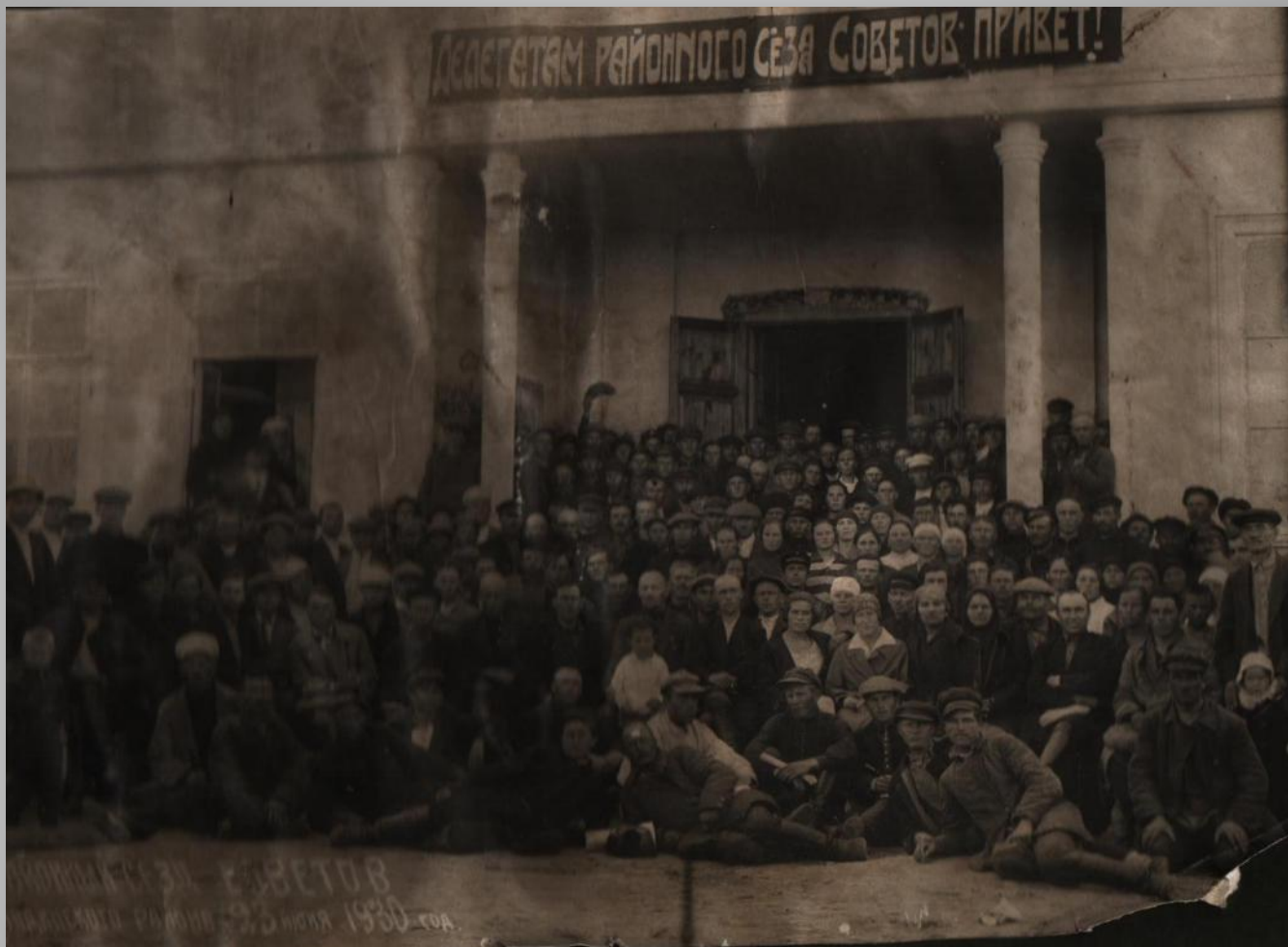
Районный съезд Советов . 1930 г. На этом съезде приняли решение о создании совхозов в Лысогорском районе.