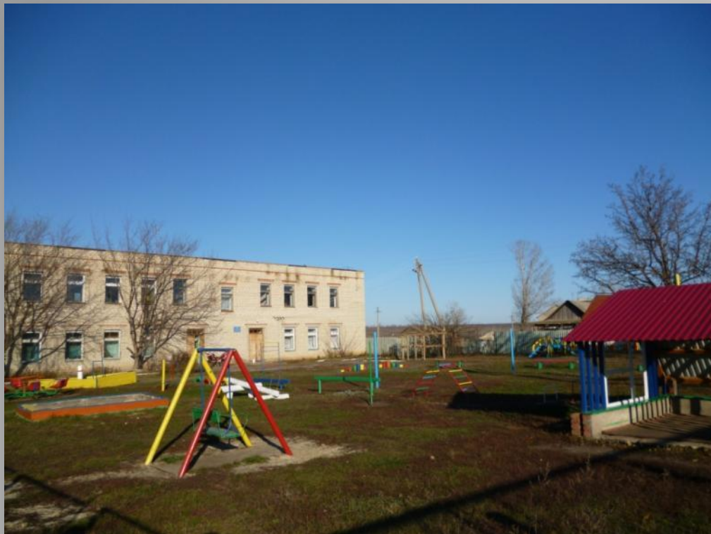
Детский сад «Родничок». Построен в 1987 году.