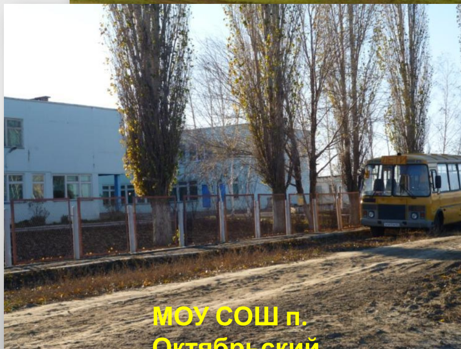
МОУ СОШ п. Октябрьский