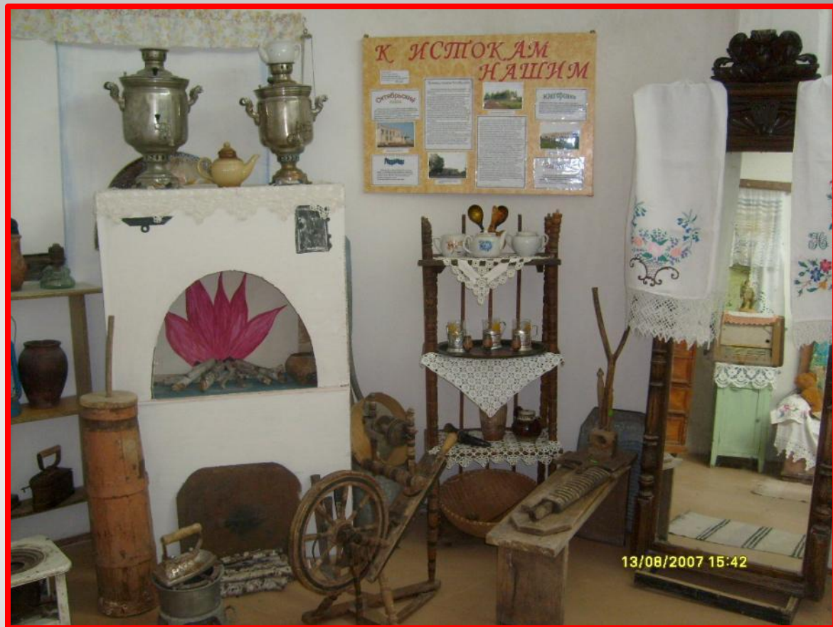
Сельский быт. 20-30-е годы XX века. Экспозиция школьного музея.

На новое место переехали 12 семей. Возникшую коммуну назвали «Новая жизнь». Государство помогало коммунарам, выделив несколько конных сеялок, жатоков и даже молотилку с конным приводом.