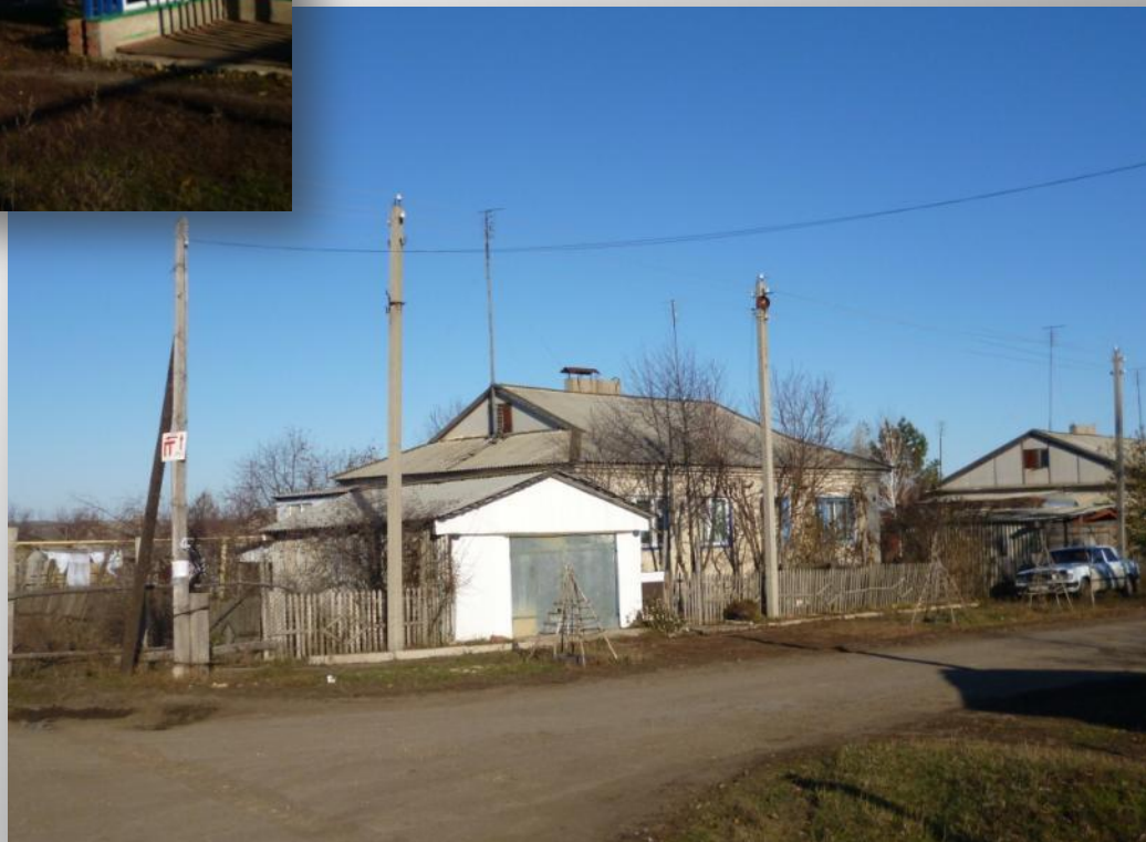
Современные коттеджи на улице Солнечная.