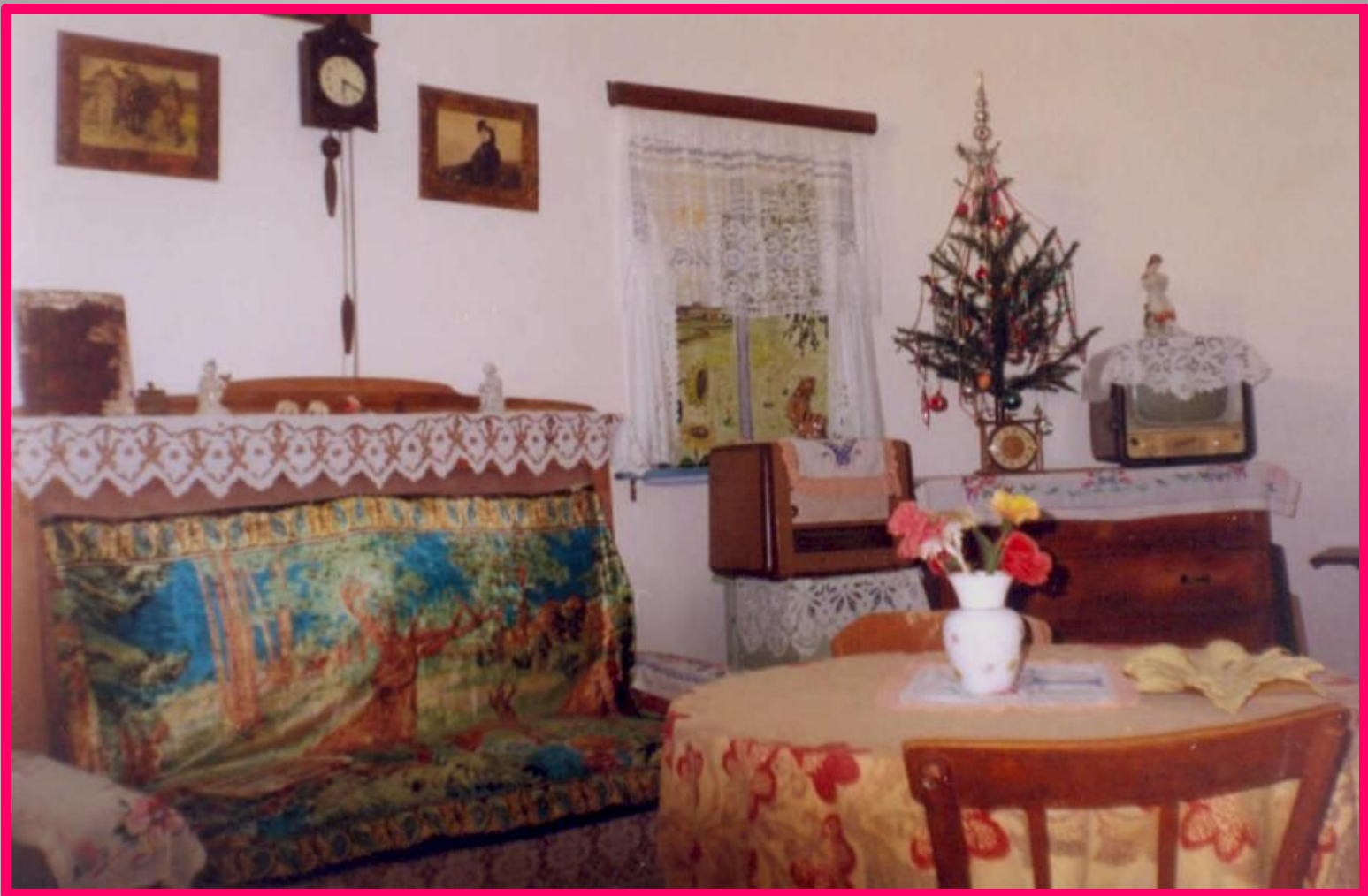
Интерьер жилой комнаты. 1950-1960 гг. Экспозиция школьного музея.