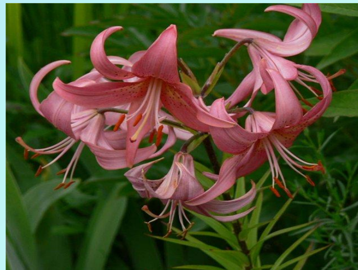
Чалмовидные, листья сильно изогнуты наружу