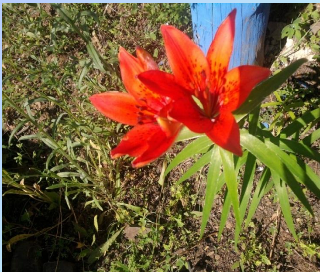
Коронковидные, листья слегка изогнуты