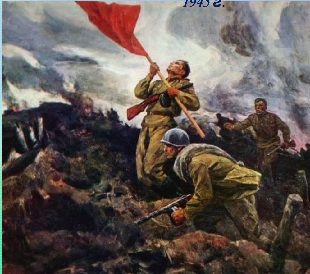
А. Широков. За Родину!