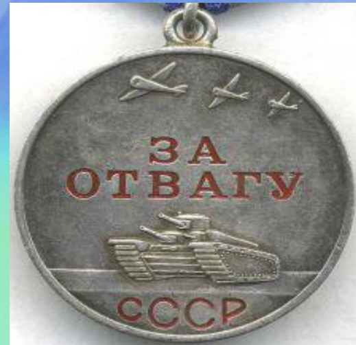
МЕДАЛЬ "ЗА ОТВАГУ"