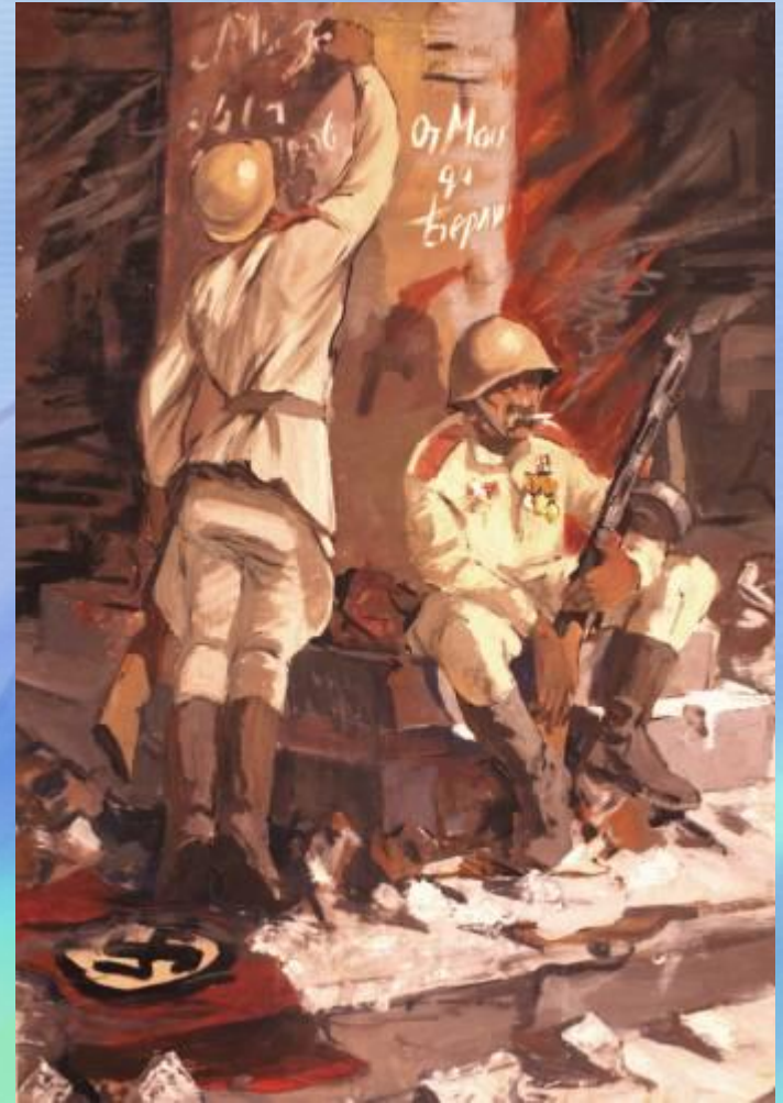
художник Володин С.А.