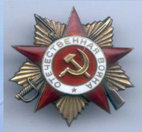
ОРДЕН ОТЕЧЕСТВЕННОЙ ВОЙНЫ