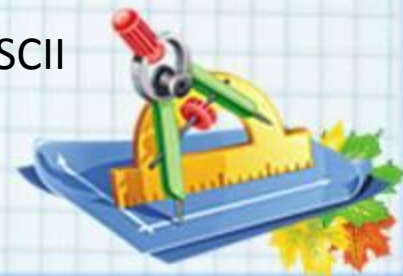
Кодовая таблица ASCII