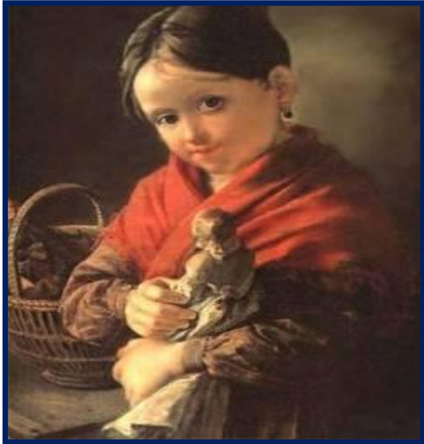
В.А. Тропинин «Девочка с куклой»

Изучение работ великих художников и создание собственных зарисовок