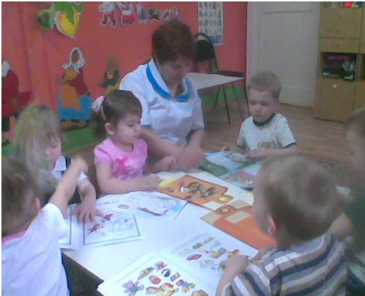
Беседа с детьми о бережном отношении к природе