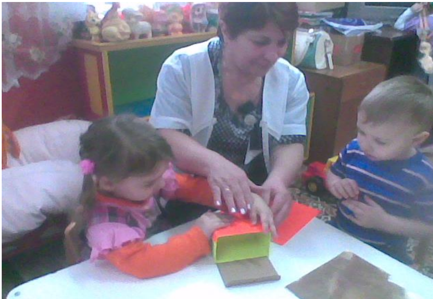
Поделка с детьми «Волшебный сундучок»