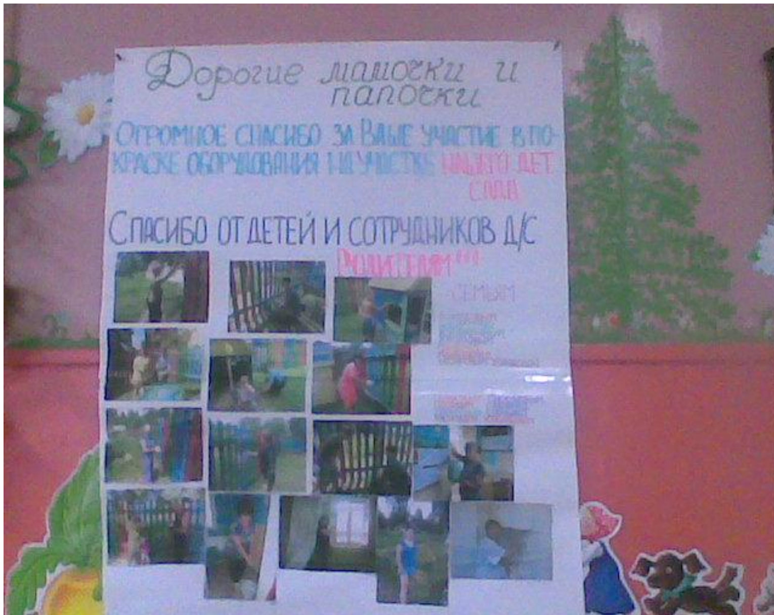
Фотовыставка уборка территории детского сада