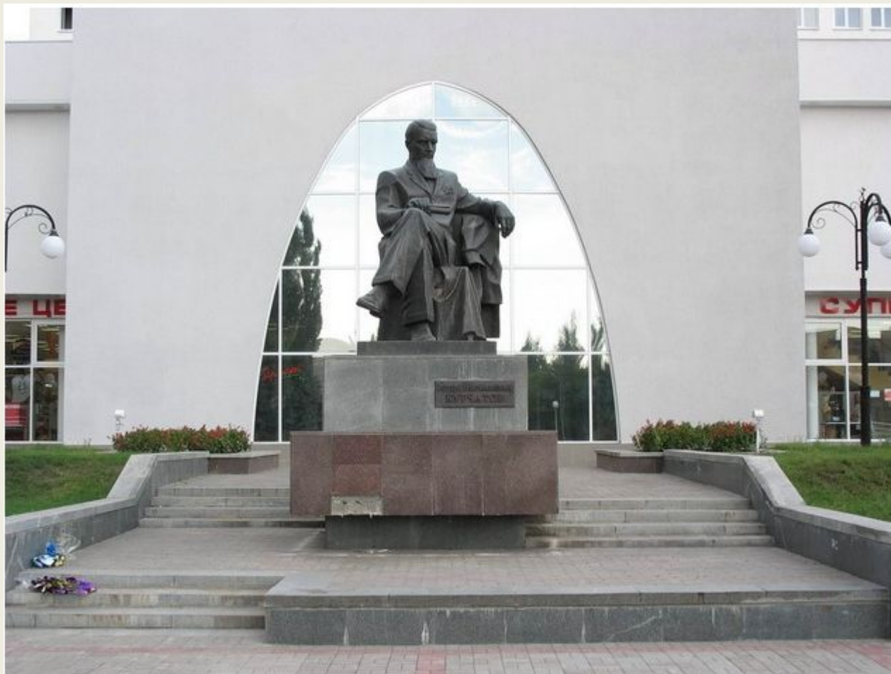
Памятник И.В. Курчатову, советскому физику, основателю Института атомной энергии.