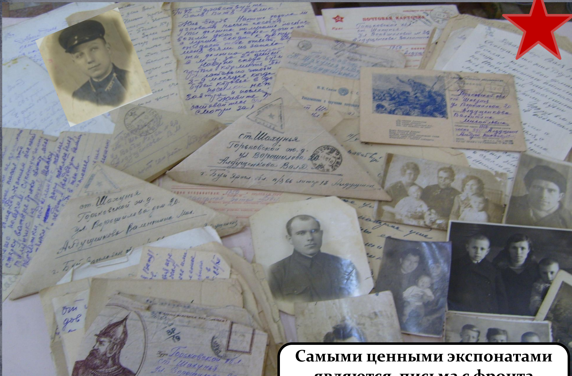
Самыми ценными экспонатами являются письма с фронта Комарова Д.Е., Алдущенко А.Н и Троцкого М.А.