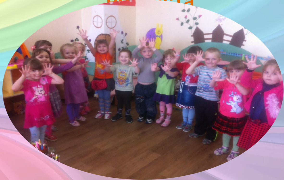
Выполнила воспитатель Стремкова Н.С.