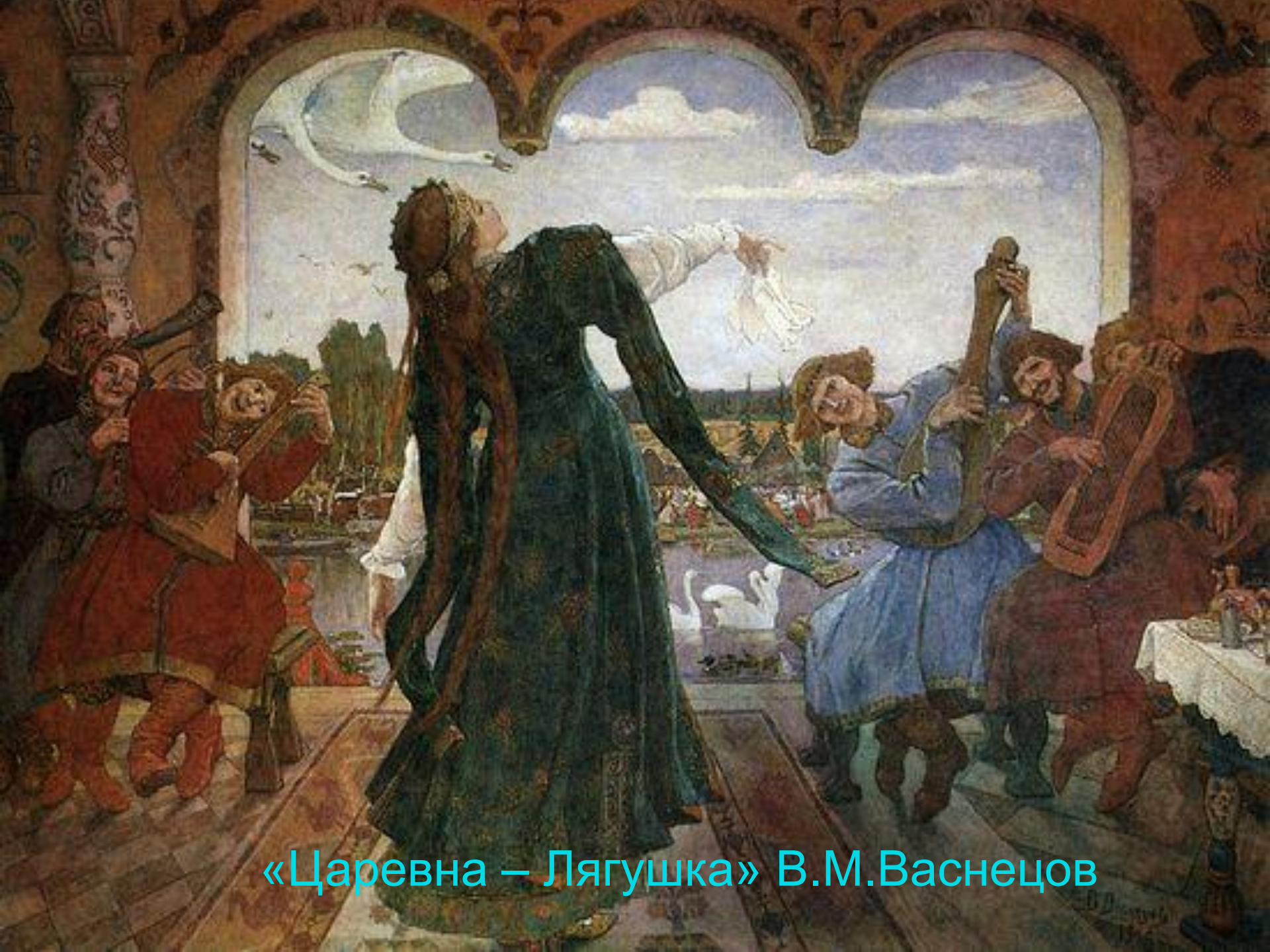
«Царевна – Лягушка» В.М.Васнецов