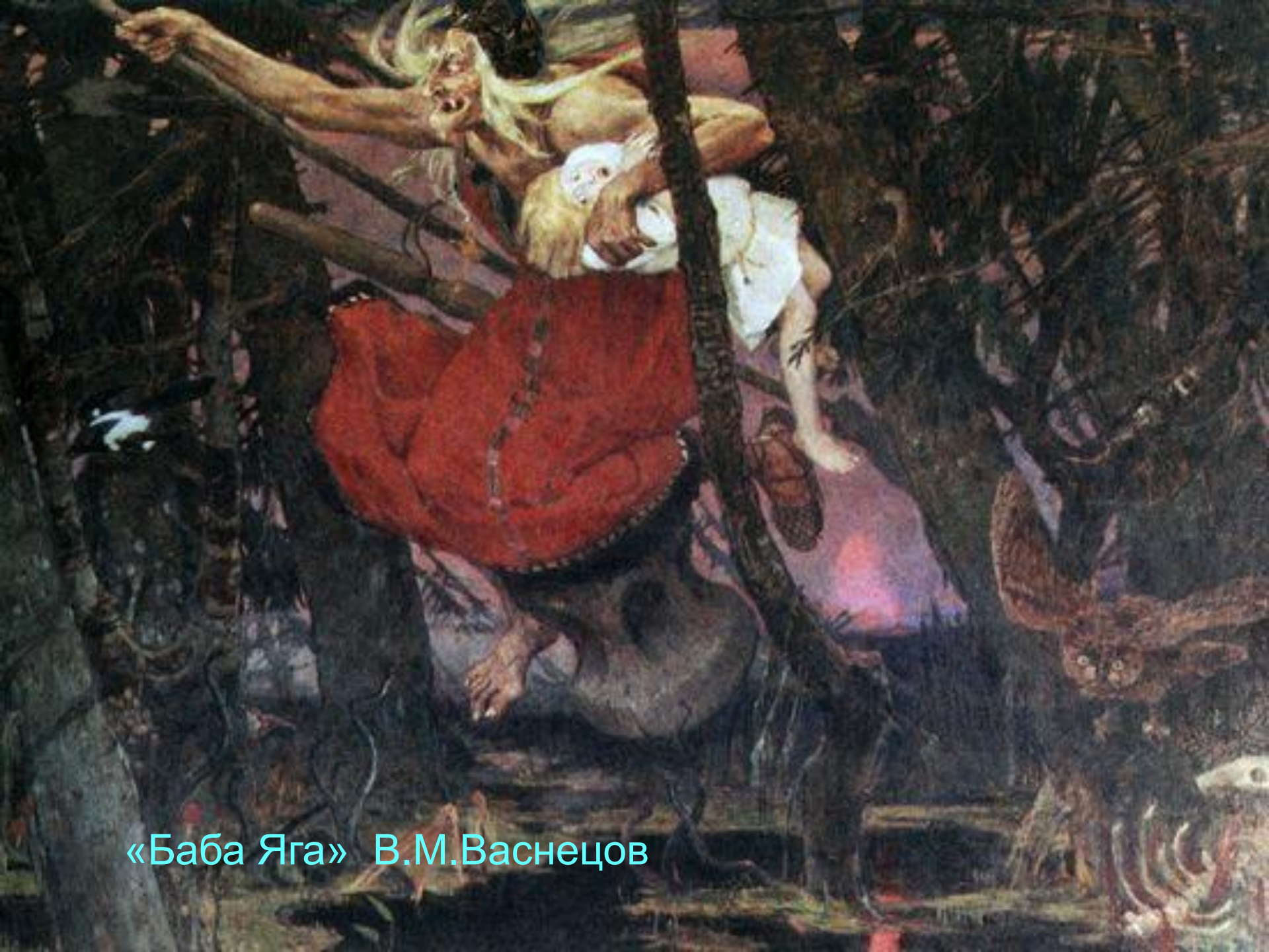
«Баба Яга» В.М.Васнецов