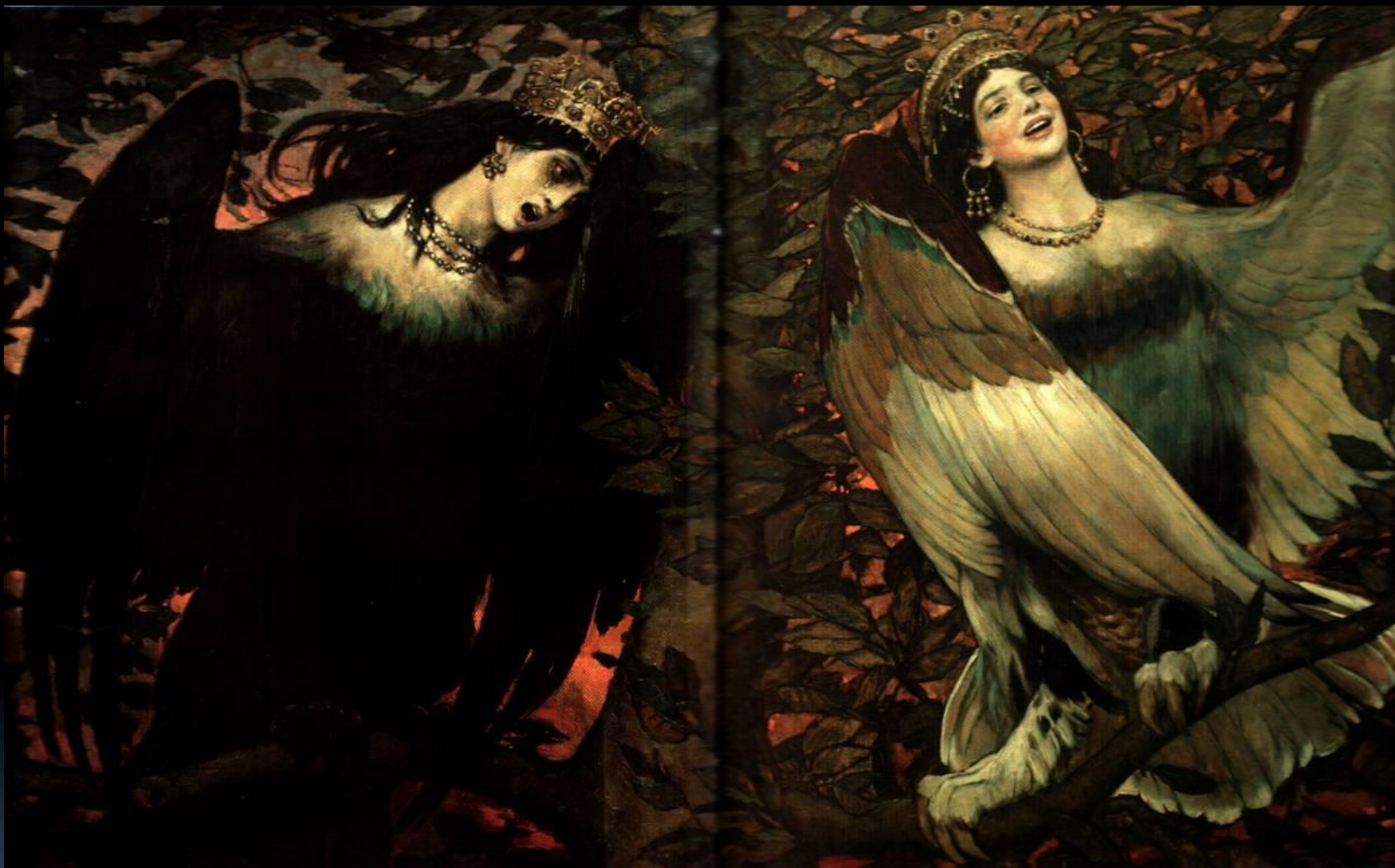
«Сирин и Алконост» В. Васнецов