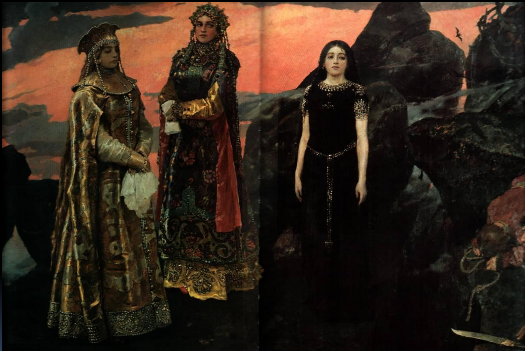
«Три царевны подземного царства» В.Васнецов