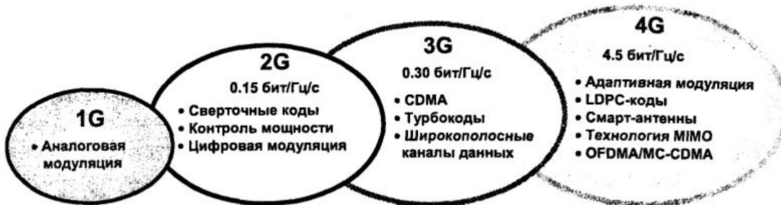
Рис. 3. Базовые технологии физического уровня систем беспроводной связи разных поколений