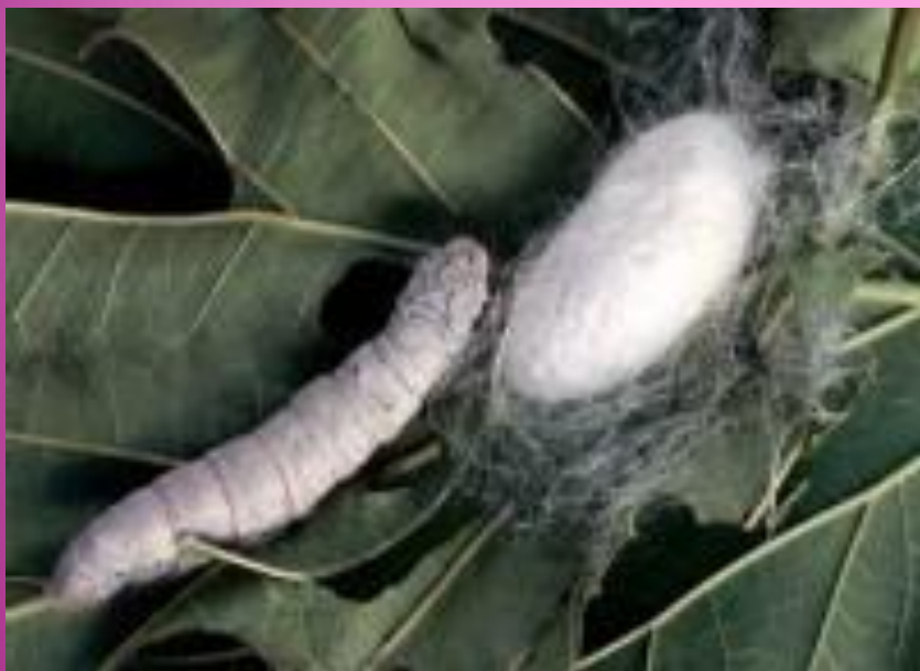
Кокон тутового шелкопряда