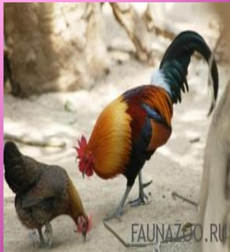
Банкивская курица 18-20 яиц в год