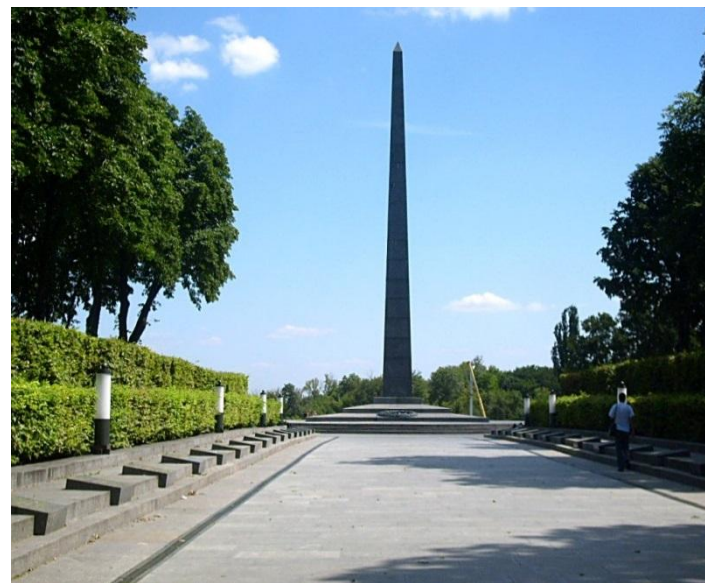
Обелиск и Вечный огонь в парке Вечной Славы в Киеве. Сооружен 6 ноября 1957 года.

В память о событиях 1941-1945 года в городе был воздвигнут Мемориальный комплекс "Национальный музей истории Великой Отечественной войны" - еще одно свидетельство того, что подвигу народа-победителя - жить в веках.