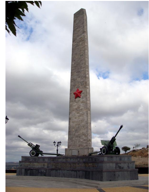
Обелиск Славы Бессмертным Героям на горе Митридат в Керчи.

Подвиги и героизм жителей Керчи - одна из самых трагичных и великих страниц Отечественной войны. За время оккупации этого города фашисты уничтожили 15 тысяч мирных граждан, угнали в Германию более 14 тысяч. Но дух гордого народа не был сломлен, ни смотря, ни на что!