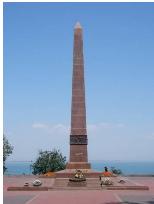
Обелиск Неизвестному матросу на Аллее Славы

За массовый героизм её защитников Одессе присвоено звание "Город-герой".