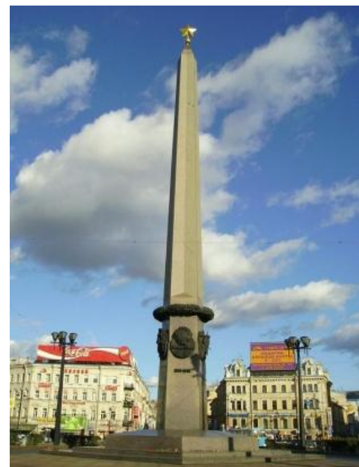
Обелиск "Городу-герою Ленинграду". Установлен в мае 1985 года на Площади Восстания.

В конце января 1944 г. величественный город, площади которого политы потом и кровью героических защитников, был полностью освобожден от вражеской блокады.