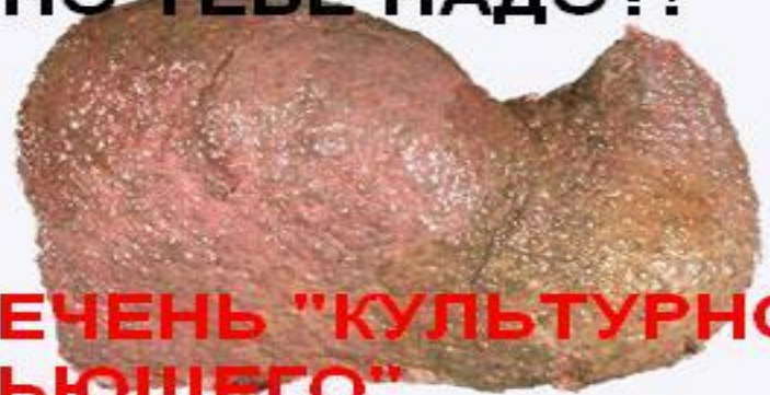
ПЕЧЕНЬ "КУЛЬТУРНО ПЬЮЩЕГО"

Даже когда созревание организма происходит относительно благополучно, эмоционально-поведенческие и личностные отклонения у детей, приобретенные в результате неправильного воспитания, затрудняют формирование нормальных межличностных отношений и социальной адаптации в целом.