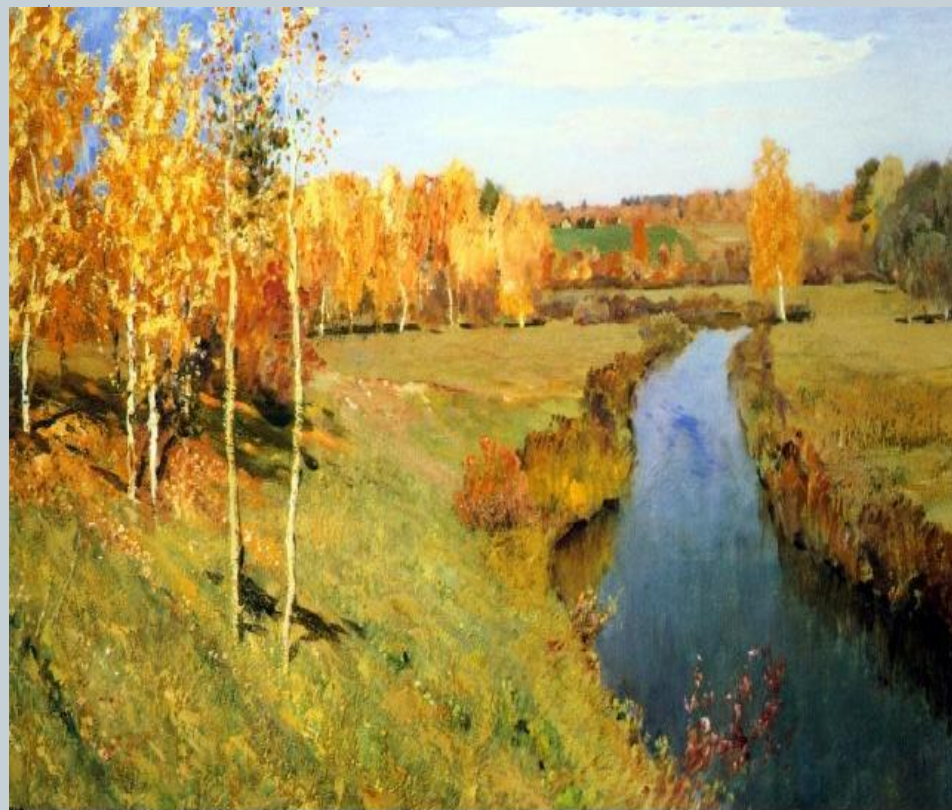
Isaac Ilich Levitan "Golden Autumn" 1895