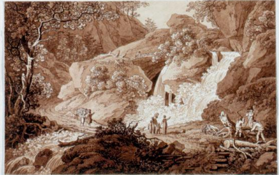
Der Amselbühl im Radevalder Grunde.