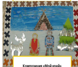
Композиция «Мой край»