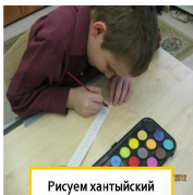
Рисуем хантыйский орнамент

Десятого декабря наша малая Родина—ханты—Мансийский автономный округ отметил свой 82 день рождения. Красив и богат наш край! Каждый год в нашей школе проходит выставка творческих работ, посвященная Дню рождения округа. Не отступили мы от доброй традиции и в этом году.