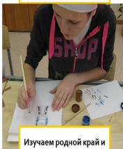
Изучаем родной край и приемы рисования