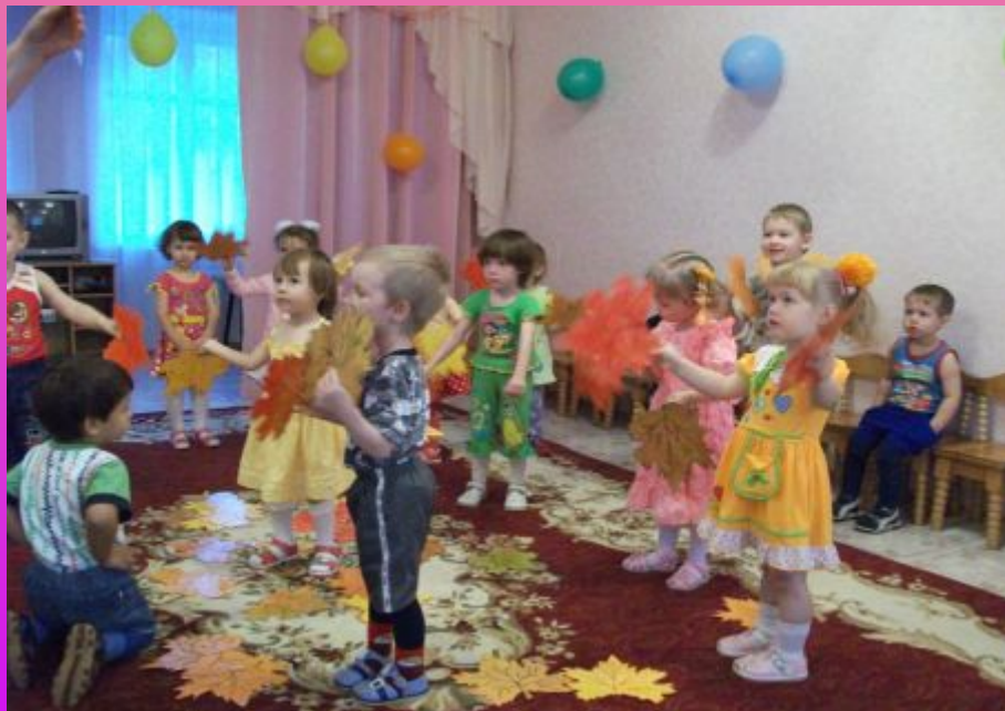
Праздники и развлечения