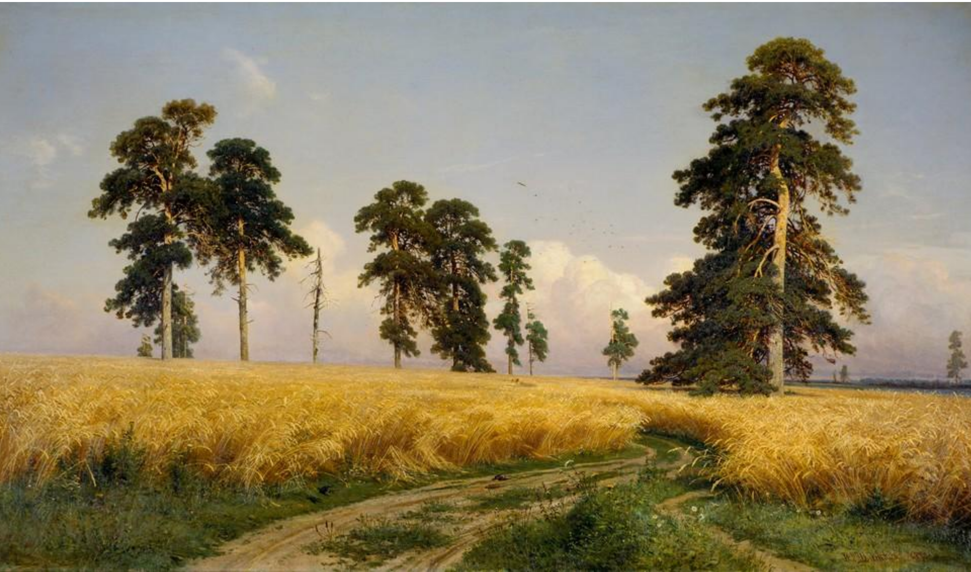
Рожь. И.И. Шишкин