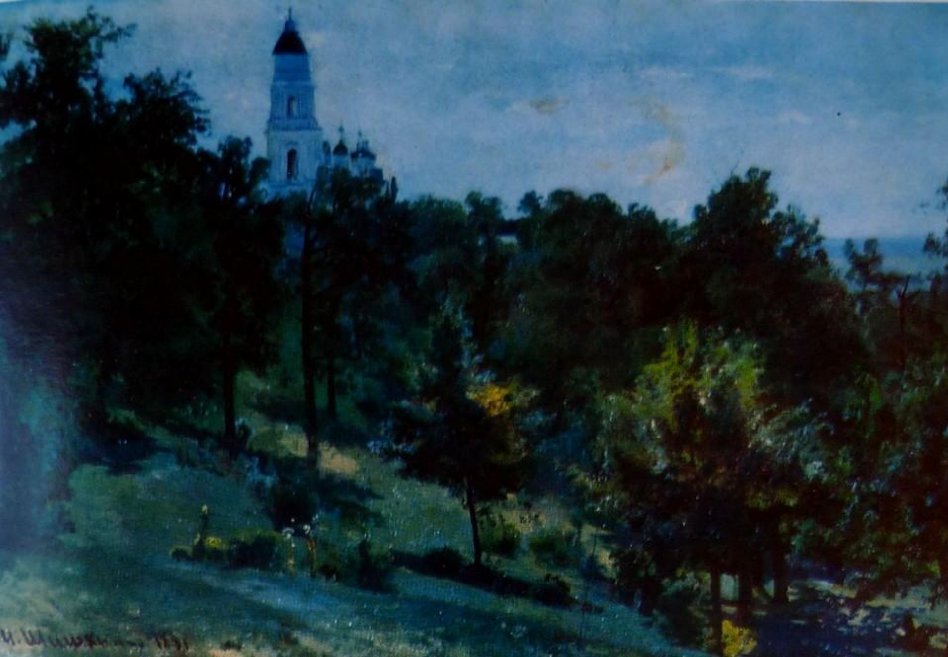
На острове Валааме