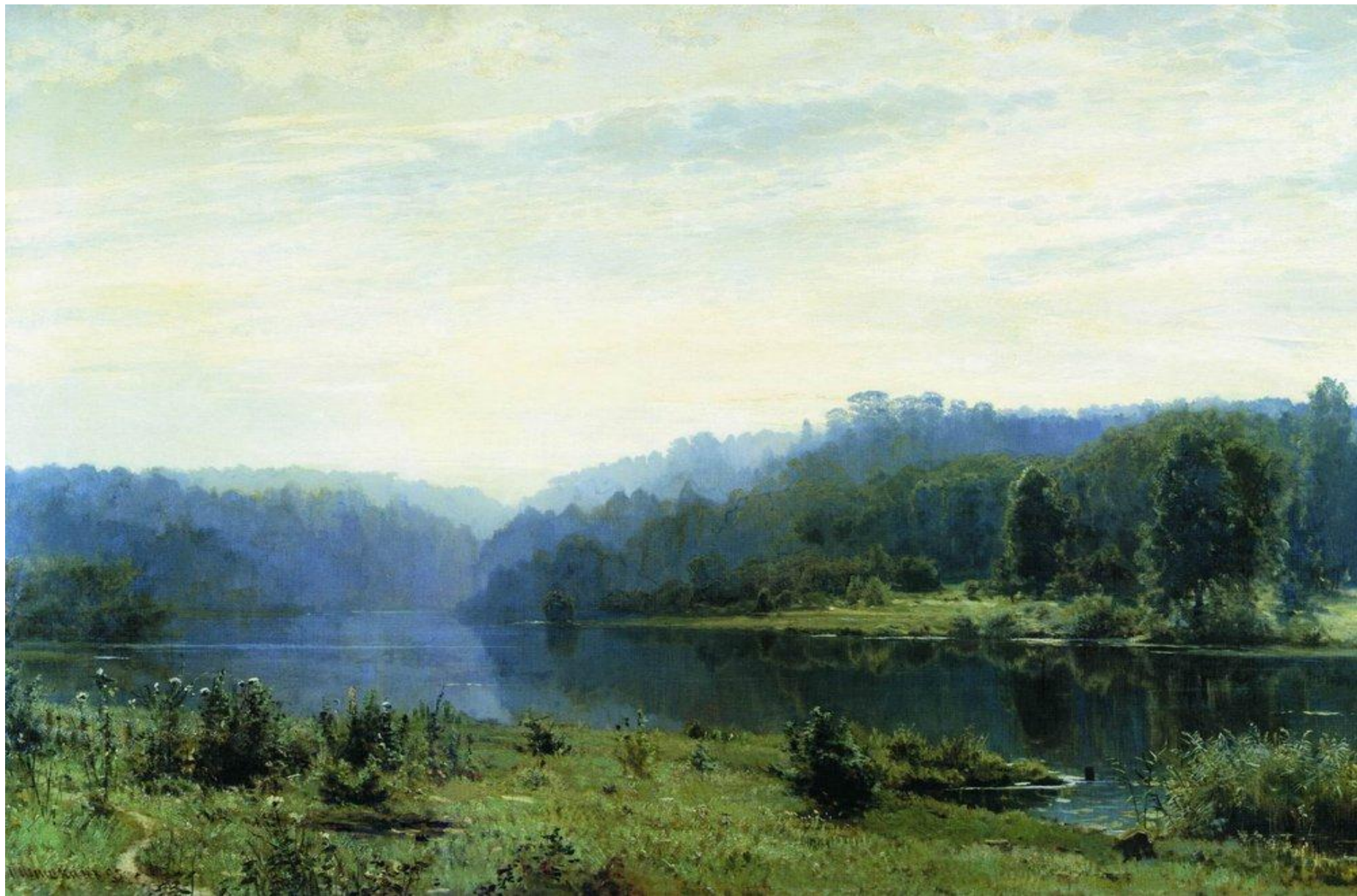
Туманное утро. И.И. Шишкин