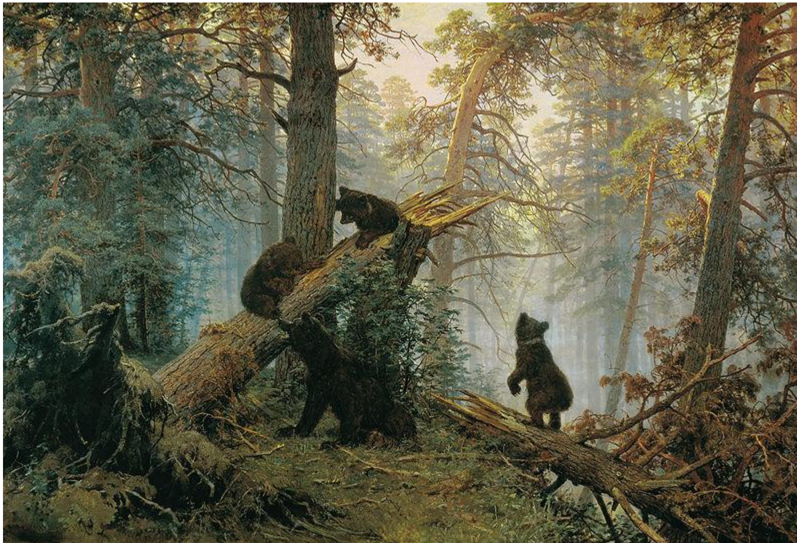
Утро в сосновом лесу. И.В. Шишкин