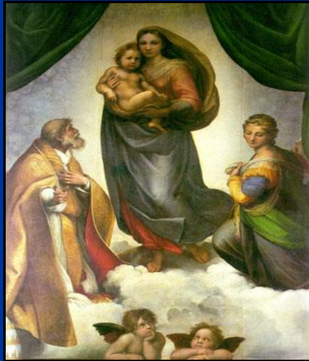
Рафаэль Сикстинская Мадонна 1512 год

В глубине картины, на заднем плане, едва различимые в золотой дымке, смутно угадываются лица ангелов, усиливая общую возвышенную атмосферу. Взгляды и жесты двух ангелов на переднем плане обращены к Мадонне. Присутствие этих крылатых мальчиков, больше напоминающих мифологических амуров, придает полотну особую теплоту и человечность.