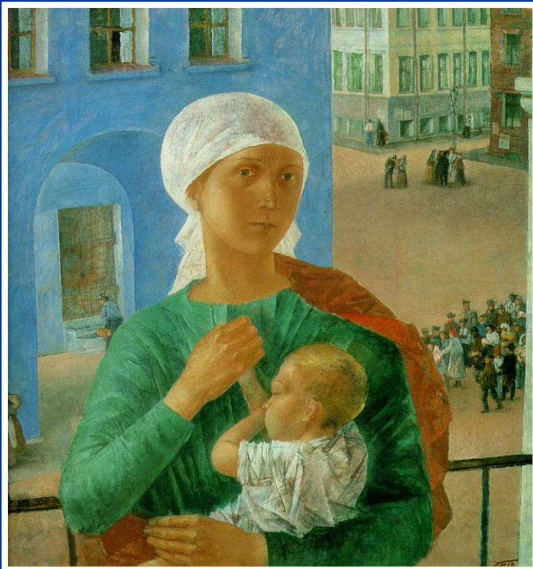
К.Петров – Водкин «1918 год в Петрограде» 1920 год

В этой картине художник необычным образом сочетает бытовой жанр с символическим образом матери, который раскрывается через тему материнства в истории искусства. Вспоминается и иконописные образы Богоматери и образ Мадонны в европейской живописи. Фоном служат реалии жизни Петербурга революционной поры.