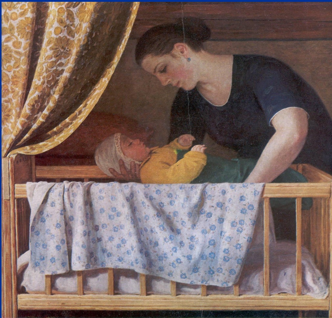
Кугач, Род. 1917. У КОЛЫБЕЛИ. 1975.

"У колыбели" – бережно и нежно опускают младенца в кроватку материнские руки. Сколько уже написано этих образов – не счесть. Отодвинулась в сторону теплого золотистого цвета занавеска, и зрительскому сердцу, именно сердцу, не глазу – открылось таинство жизни – дитя и склонившаяся над ним мать. Золотое сияние исходит от младенца и оно сгармонировано с золотистым цветом, разлитым в картине. В работе, философски осмысляющей жизнь, этот цвет несёт символическое звучание. Вечное тепло жизни! Наделённые поразительным духовным богатством мадонна и младенец замкнуты друг на друга. Величественная красота жизни!