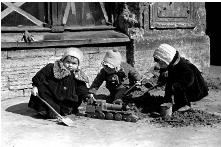
Дети играют на одной из улиц г. Ленинграда. 1942 год.

http://www.spletnik.ru/blogs/govoryat_что/83351_detstvo-opalenne-voynou