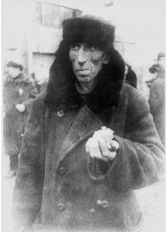
Неизвестный автор. Житель Ленинграда возле булочной после получения хлебного пайка. Зима 1941 – 1942 © Центральный государственный архив кино-, фото-, фоно- документов Санкт-Петербурга