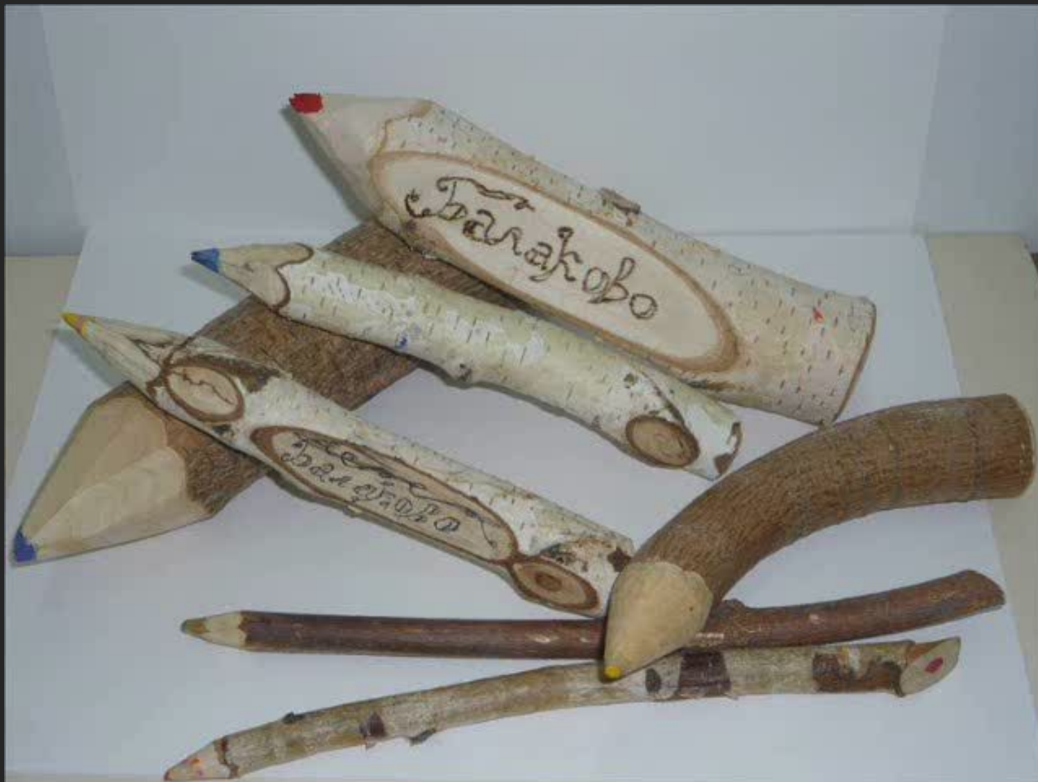
Изготовление сувенирной продукции из древесины на уроках технологии в 5-6 кл.