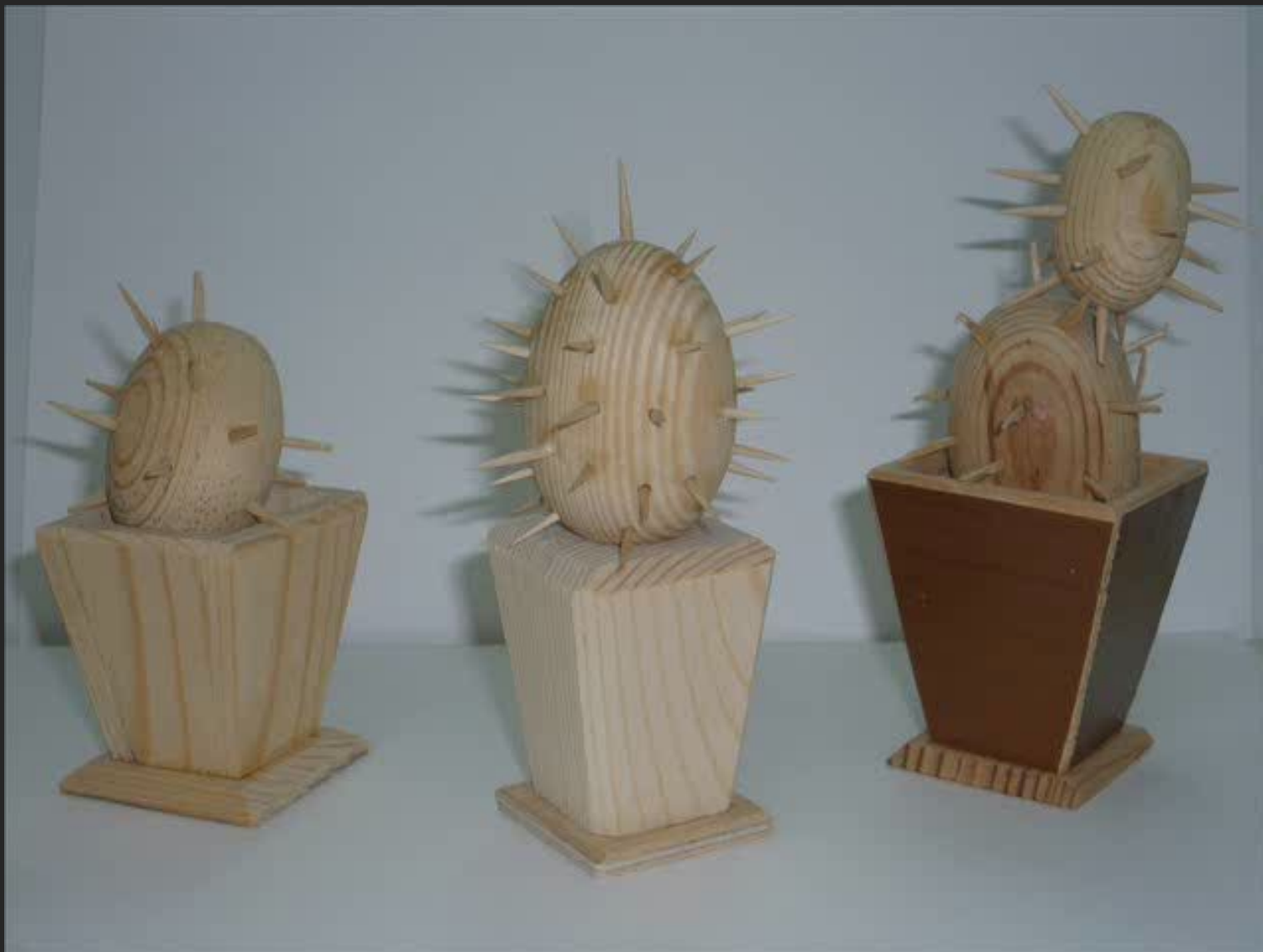
Изготовление сувенирной продукции из древесины на уроках технологии в 5-6 кл.