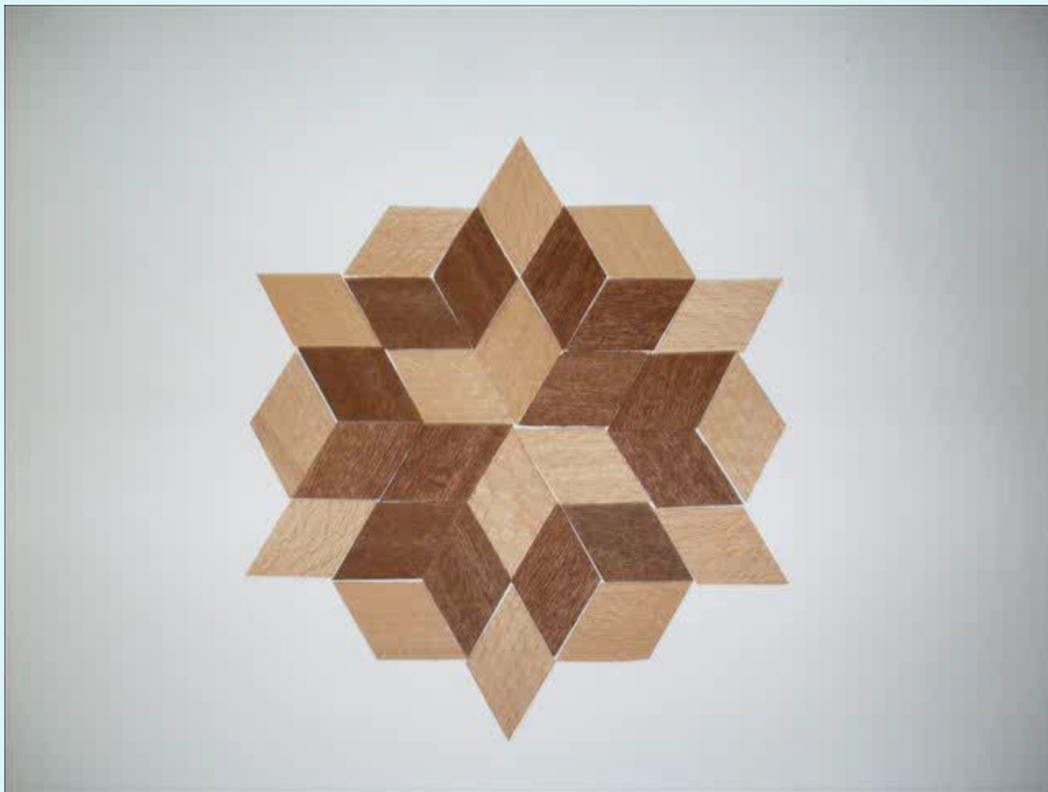
Изготовление сувенирной продукции из древесины на уроках технологии в 5-6 кл.