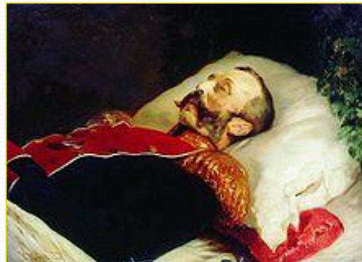
Портрет Александра II на смертном одре