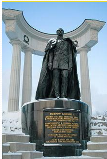
Памятник установлен на гранитной площадке с северо-восточной стороны Храма Христа Спасителя