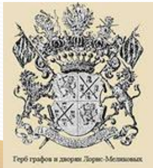
Герб графов и дюков Лорис-Меликовых