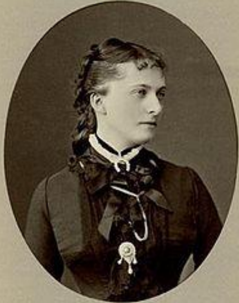
Портрет Екатерины Долгоруковой