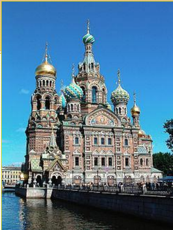
Храм Спаса на Крови в Санкт-Петербурге, возведенный как памятник Царю-Мученику