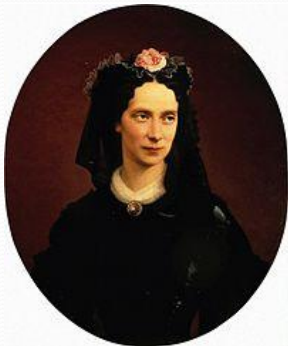
Портрет императрицы Марии Александровны