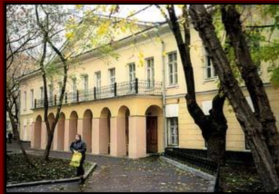
Дом №7 на Никитском бульваре, где умер Гоголь