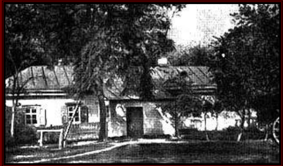
Дом доктора М.Я.Трохимовского в Сорочинцах, где родился Гоголь