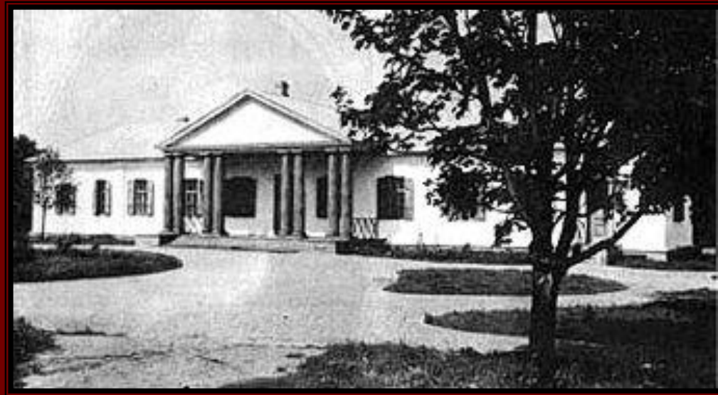
Родительский дом в Васильевке