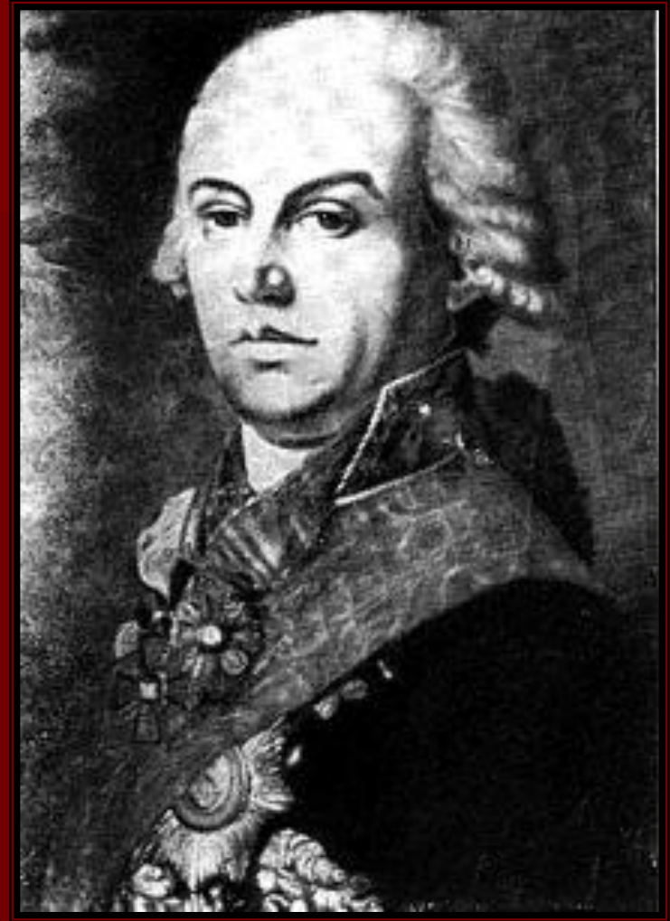
Дмитрий Прокопович Трощинский