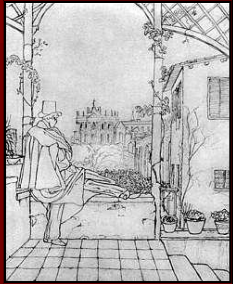
Н.В. Гоголь на террасе виллы З.А. Волконской в Риме. Рисунок В.А. Жуковского. 3 февраля (22 января) 1839 г.