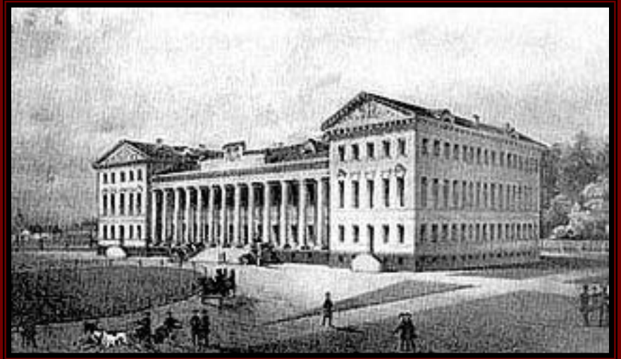
Нежин. Гимназия высших наук