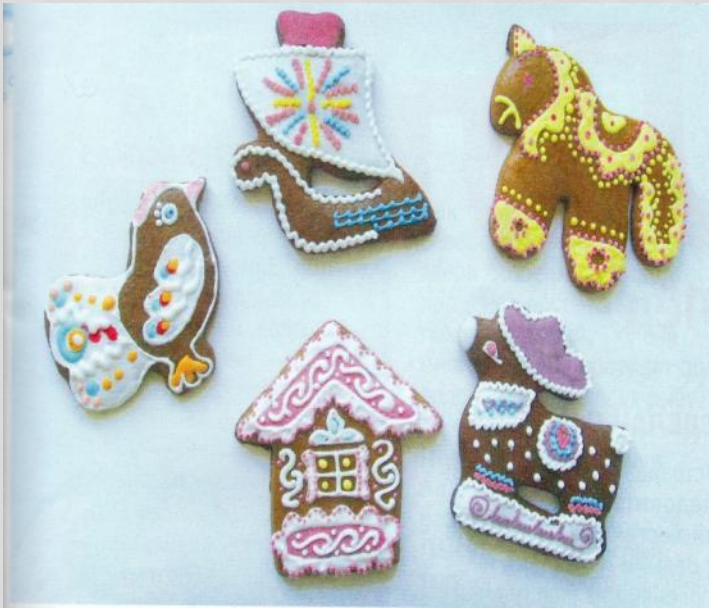
«Козули» из Архангельска