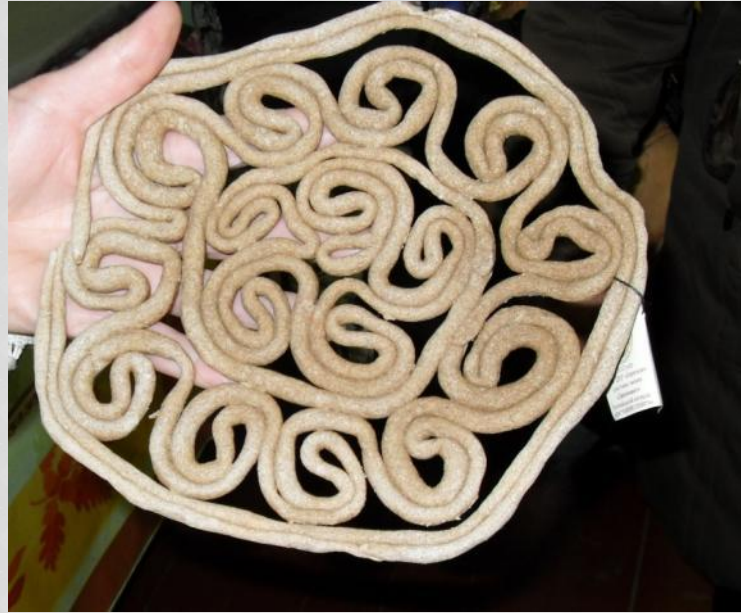
«Тетёрки» из Каргополя