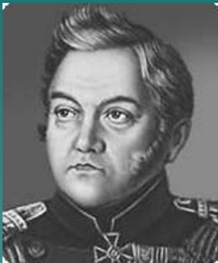
М. П. Лазарев.