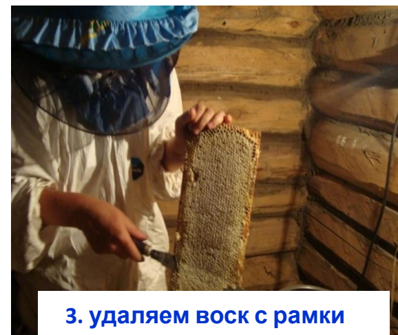
3. удаляем воск с рамки