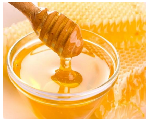
4. качаем мед с помощью медогонки