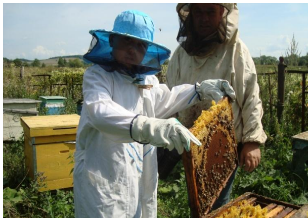
2. вынимаем рамки с медом из улья