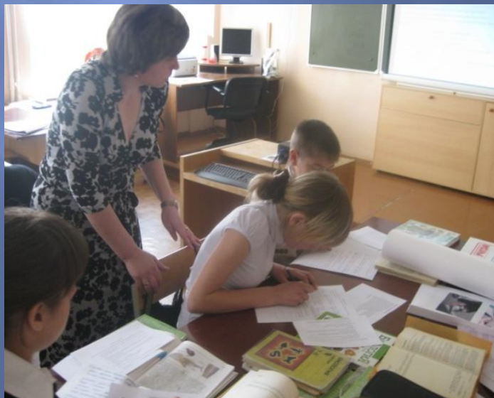
Форма урока по технологии сотрудничества в малых группах