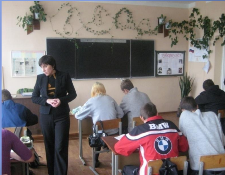
Традиционная форма урока