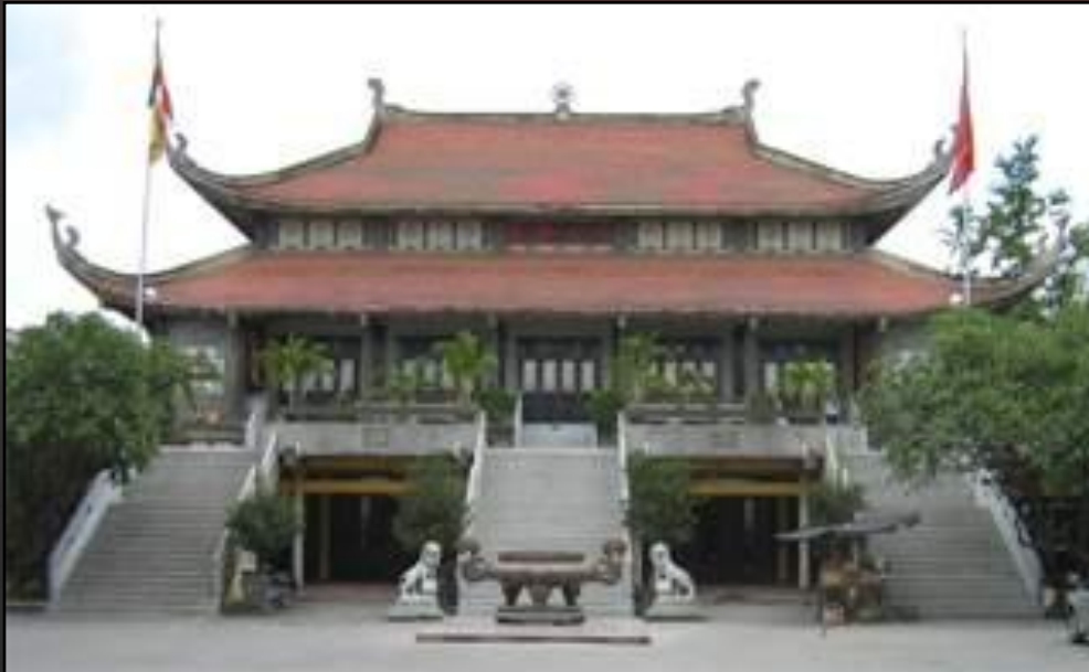
Действующая буддийская пагода в г.Хошимине