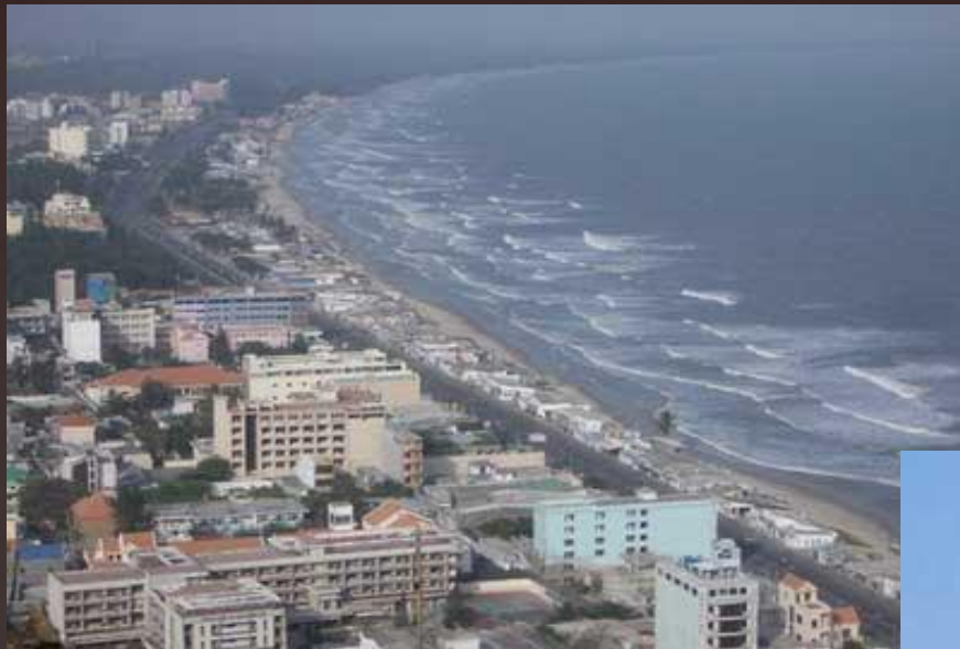
Мыс Святого Жака