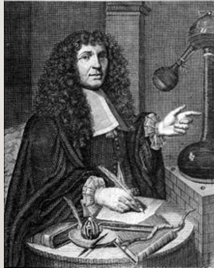
Moses Charas Pharmacopoeus ~ Regius ~