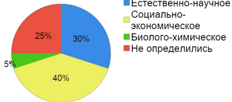
8 класс (середина учебного года)