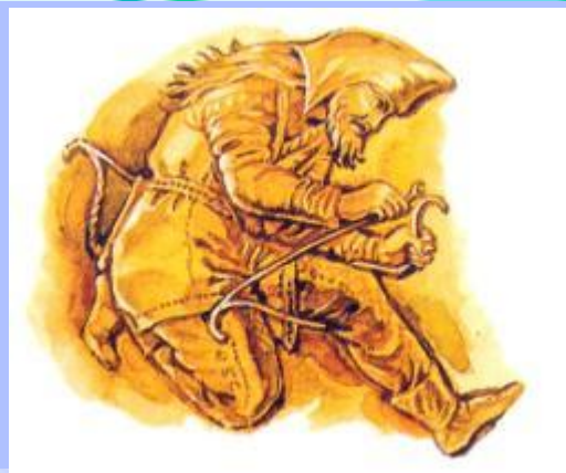
Скифский лучник. Изображение на евнегреческой вазе