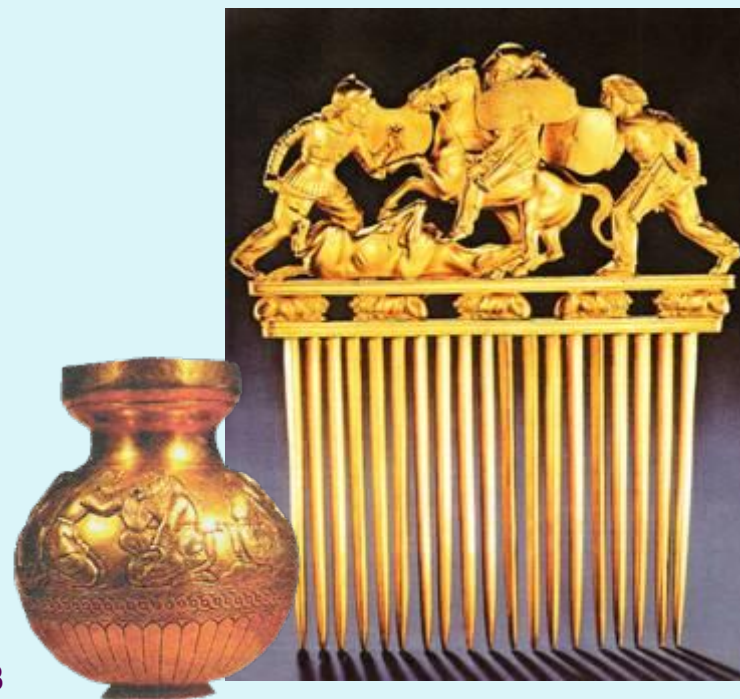
Золотые вещи из скифских курганов