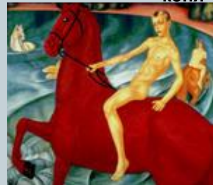
К. Петров-Водкин "Купание красного коня"