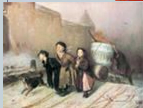
В. Г. Перов "Тройка"