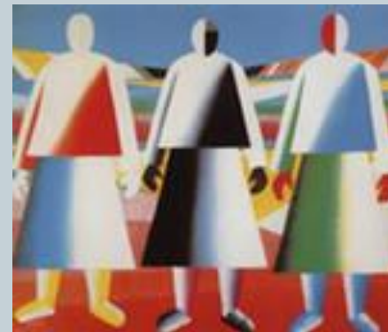
К.С. Малевич «Девушки в полях»