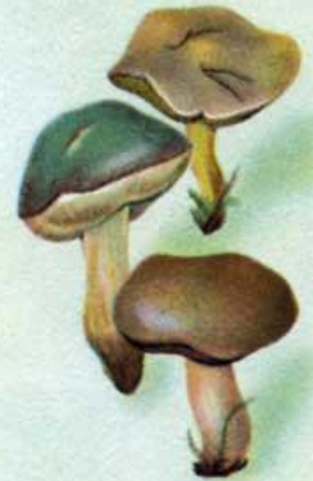
Моховик и козляк