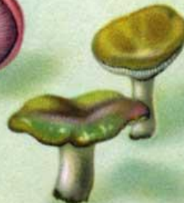
Сыроежка зеленая, желтая, красная