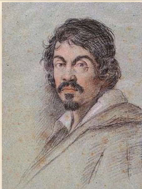
Микеланджело де Караваджо