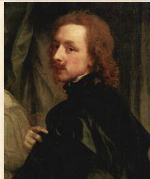
Антонис ван Дейк