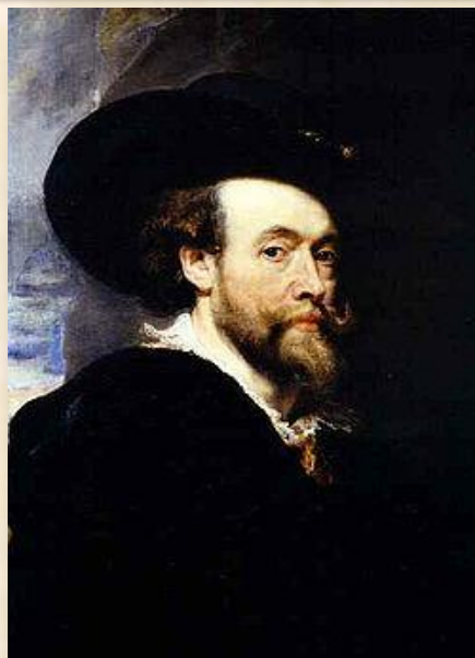
Пітер Пауль Рубенс