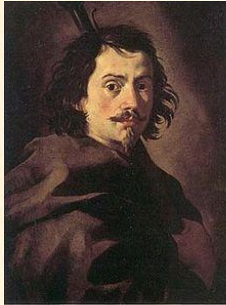
Франческо Борромин и