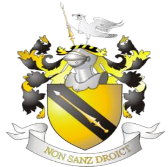
Герб рода Шекспир

Предмет исследования: стилистические особенности сонетов Шекспира