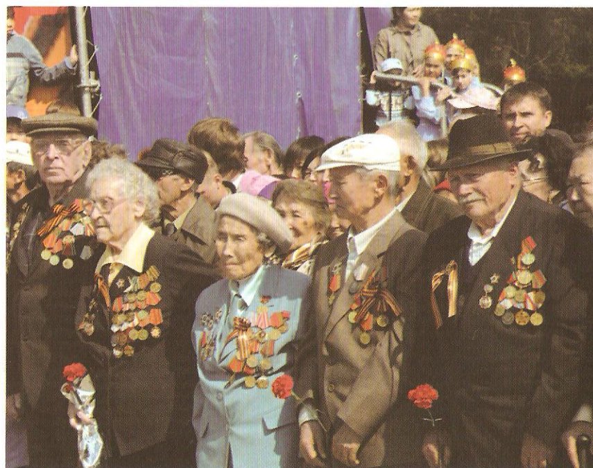
Ада-чурттуң Улуг дайынының киржикчилери Тиилелге хүнүнде (2007 чыл)