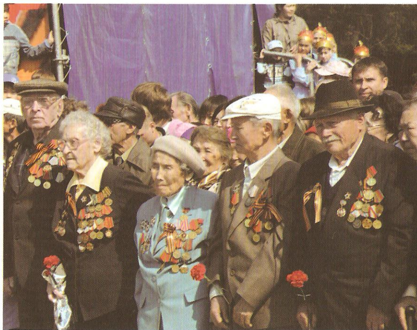
Ада-чурттуң Улуг дайынының киржикчилери Тиилелге хүнүнде (2007 чыл)