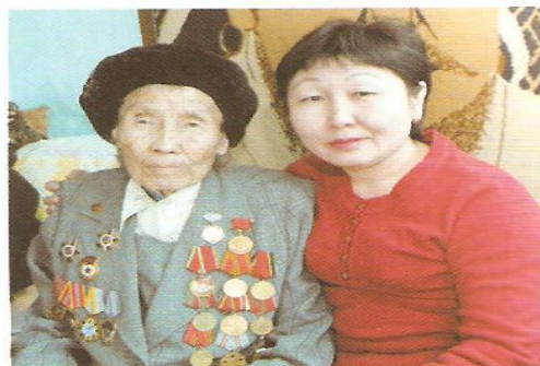
База бир уйнуу-биле кады