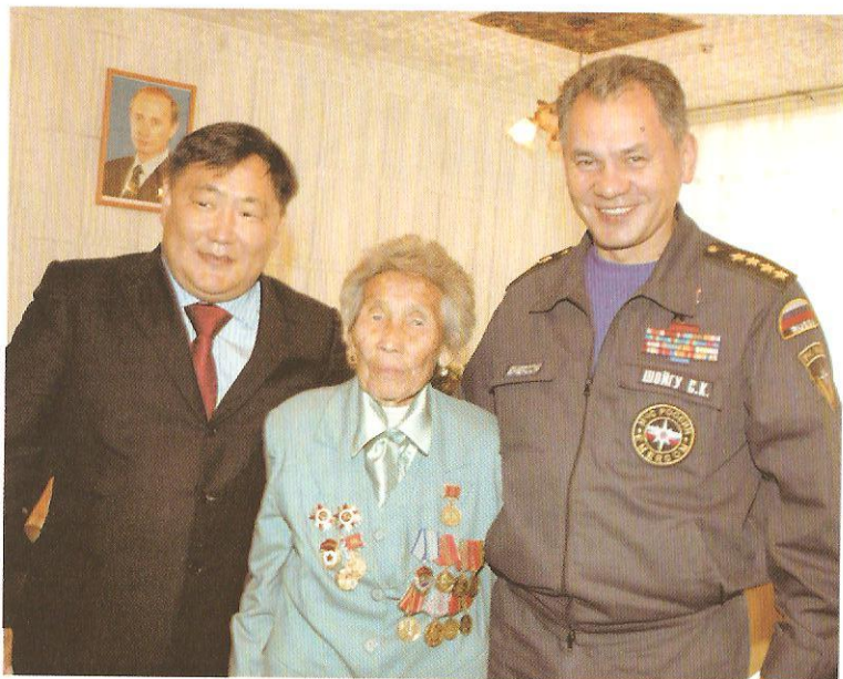
ТР-ний Чазааны Даргазы Ш.В. Кара-оол, фронтуучу В.Ч. Байлак, РФ-тин ОБЯ-нын сайыды С.К. Шойгу