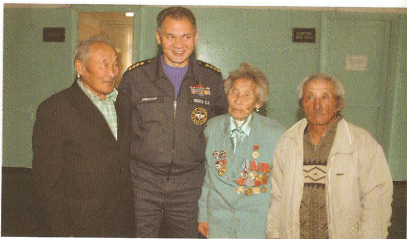
С.К. Шойгу дайынның болгаш күш-ажылдың хоочуннары-биле