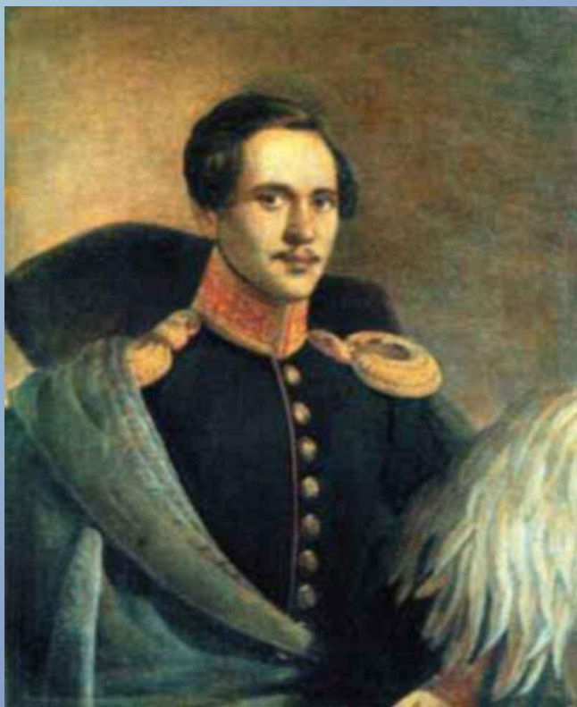
портрет кисти Ф.Будкина