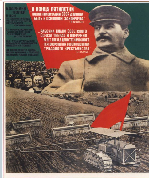
213. Клуцис Г. Ударники полей, в бой за социалистическую реконструкцию... 1932

В подобных произведениях освещалось колхозное движение, вовлечение крестьян в колхозы, строительство, говорилось об упрочении новой жизни в деревне.