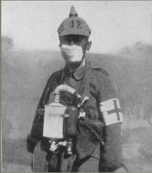
Германский медик в защитной маске