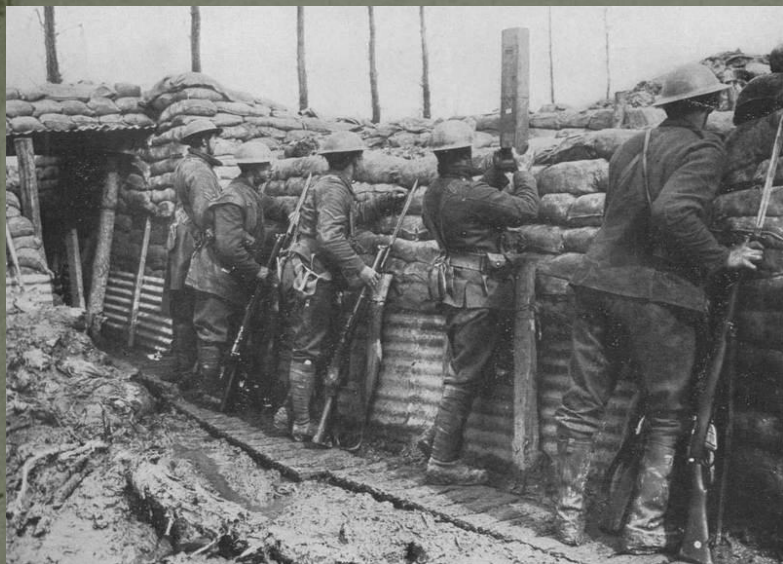
Канадские траншеи на Западном фронте