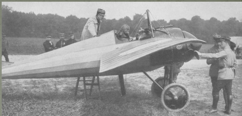
Скоростной французский моноплан