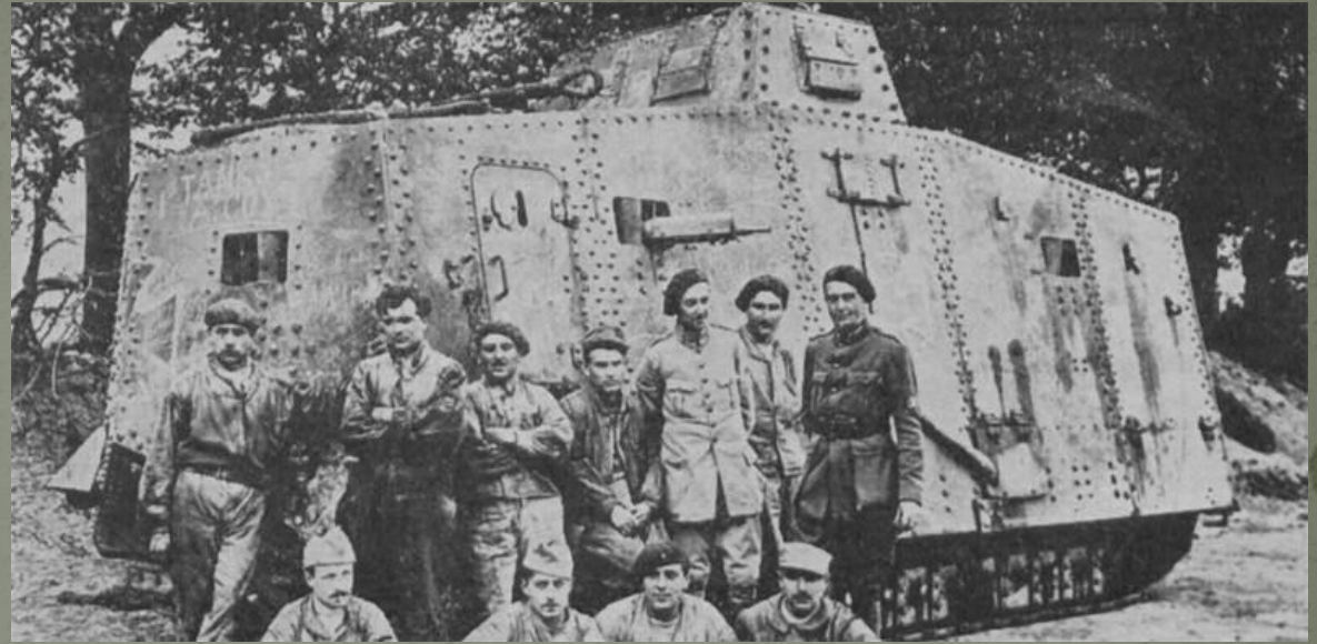
Германский танк, захваченный французами