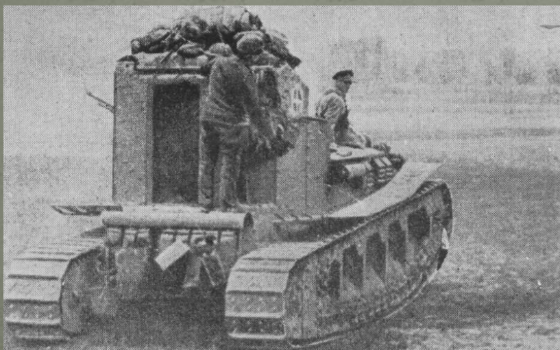
Британский танк, 1918