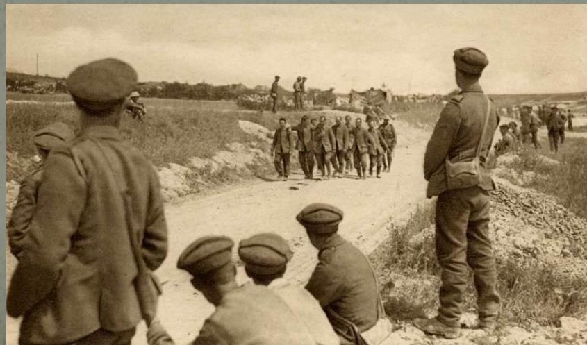
Германские военнопленные захваченные на Сомме