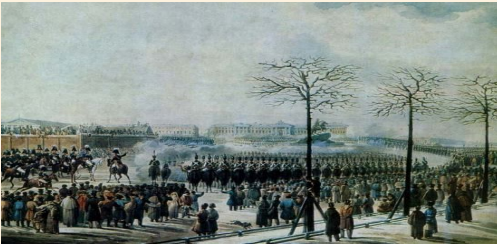
Сенатская площадь 14 декабря 1825 года