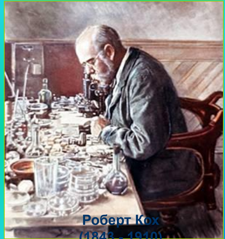
Роберт Кох (1843 - 1910)

В 1993 г. Всемирной организацией здравоохранения туберкулез был объявлен национальным бедствием, а день 24 марта «Всемирным днем борьбы с туберкулезом».