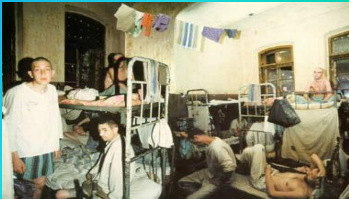
Лица, отбывающие наказание в местах лишения свободы