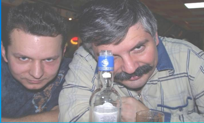
Люди, страдающие алкоголизмом