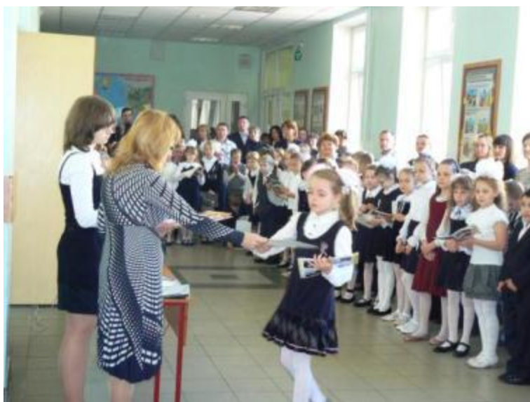
Вручение дневников отличникам